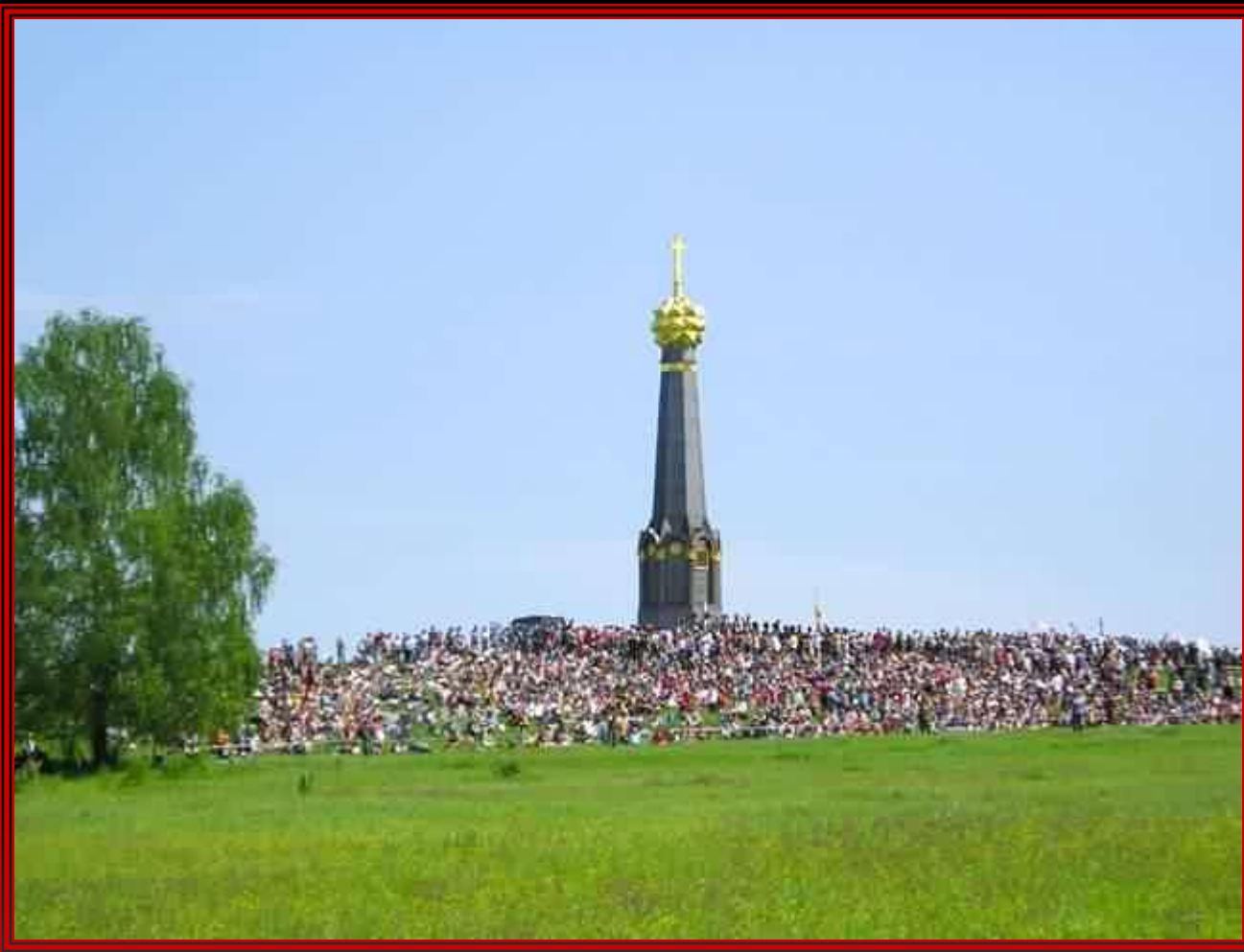
Главный монумент героям Бородинского сражения на батарее Раевского