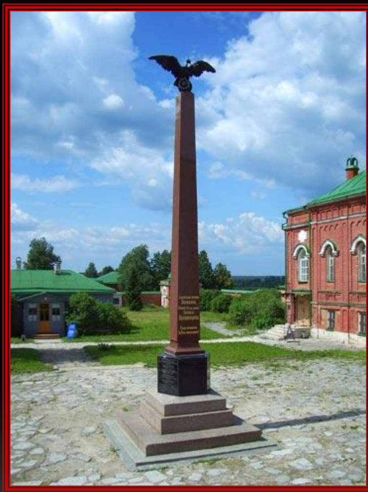
Памятник третьей Пехотной дивизии