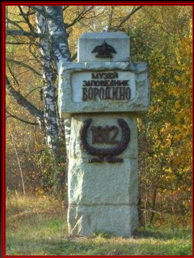
Памятный знак на границе Бородинского поля