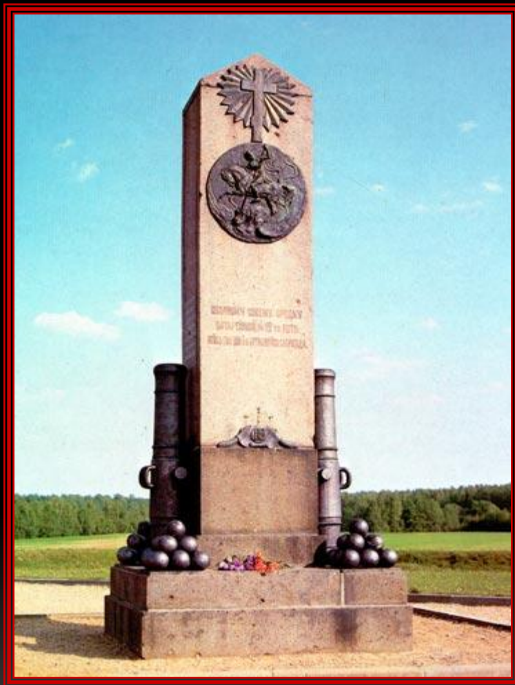
Памятник 12 роте на Шевардинском редуте