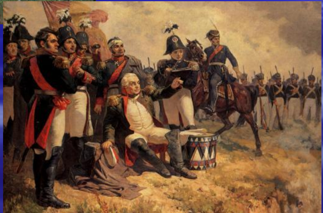
М. И. Кутузов на командном пункте в день Бородинского сражения