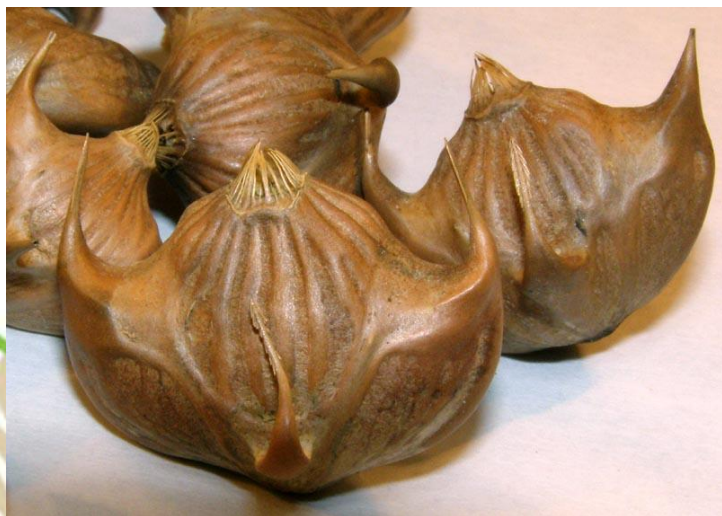
Рогольник плавающий (водяной орех, чилим)