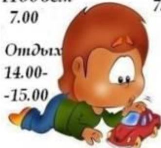
Отдых 14.00- -15.00