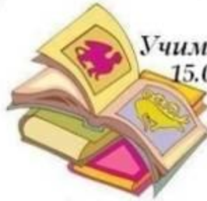
Учим уроки 15.00-17.00