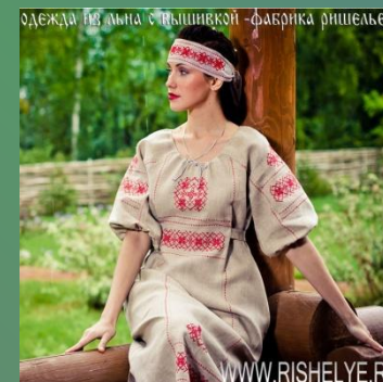
Одежда из льна