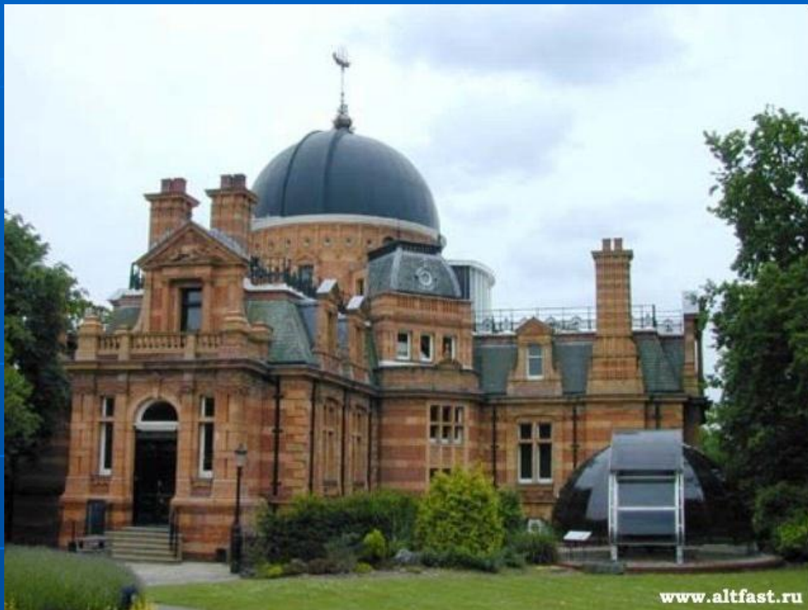
Королевская обсерватория в Гринвиче