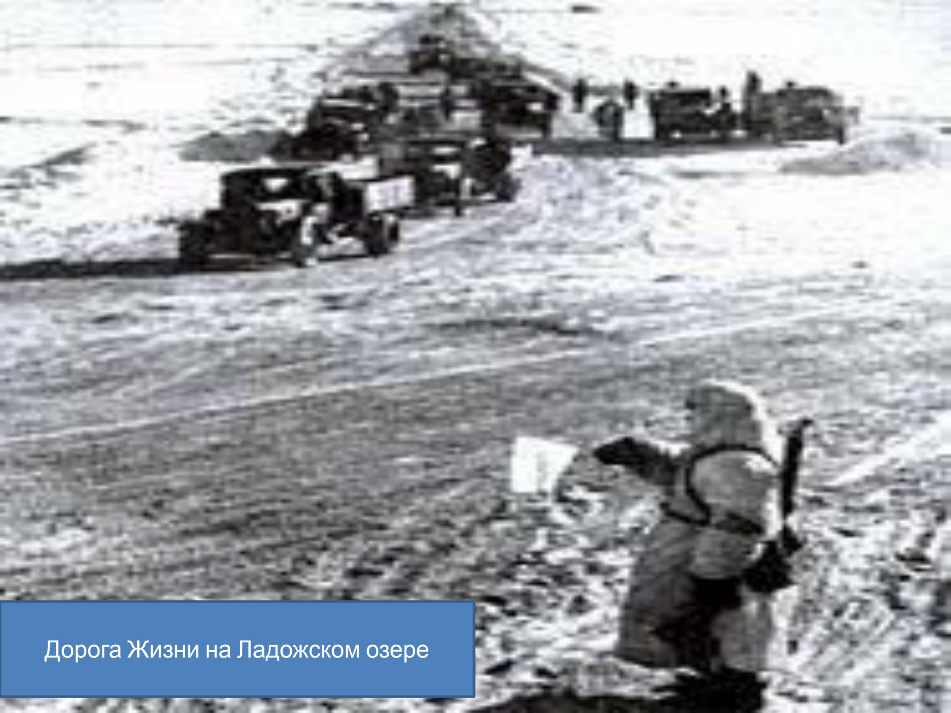
Дорога Жизни на Ладожском озере