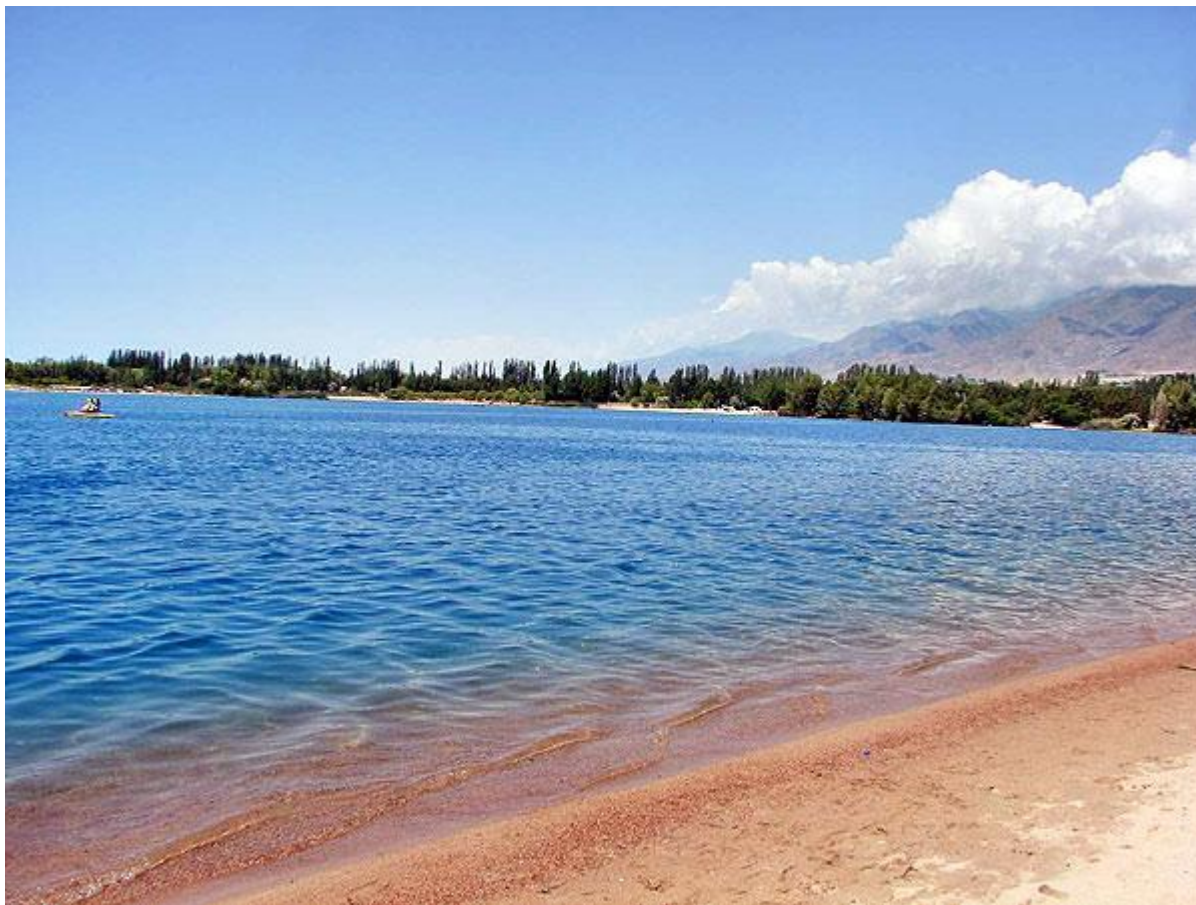
Озеро Иссык Куль