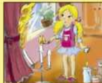
Нельзя зажигать огонь без взрослых