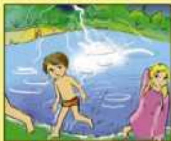
Во время грозы нельзя находиться в воде