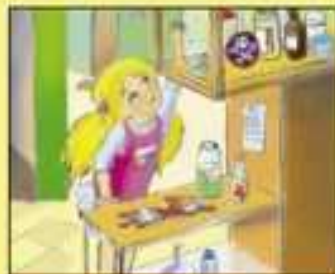
Нельзя трогать бутылочки и баночки