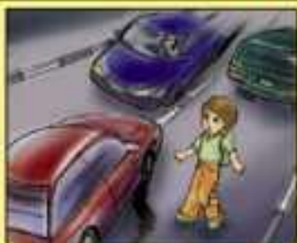
Нельзя нарушать правила дорожного движения