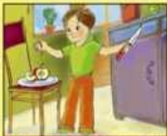
Нельзя пользоваться острыми предметами без разрешения