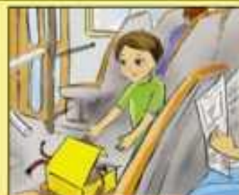
Нельзя трогать незнакомые предметы