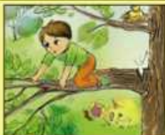
Нельзя забираться высоко