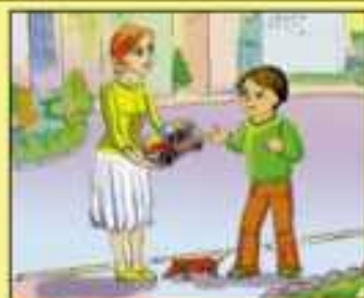
Нельзя разговаривать с незнакомыми людьми