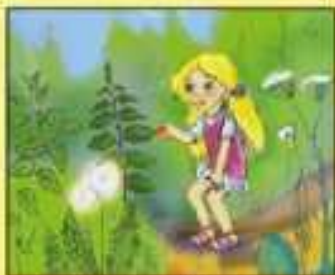
Нельзя трогать незнакомые растения