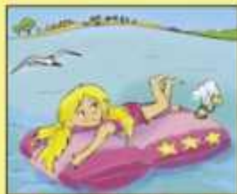
Нельзя далеко заплывать на надувных матрацах