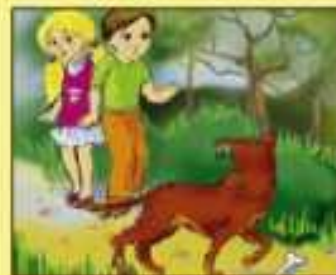
Нельзя подходить близко к незнакомым животным