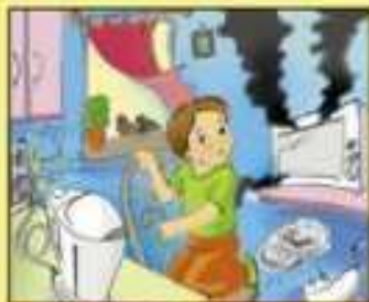
Нельзя включать электроприборы без взрослых