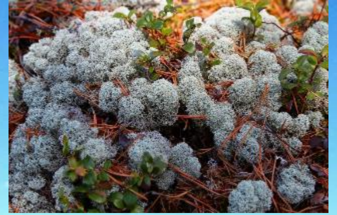
Олений лишайник (ягель)