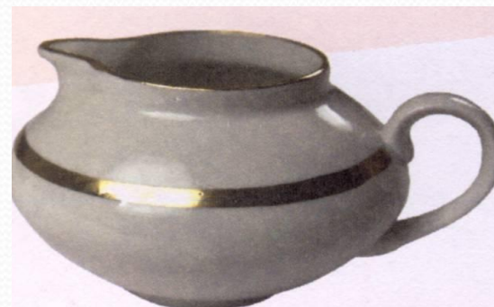
● С МОЛОКОМ