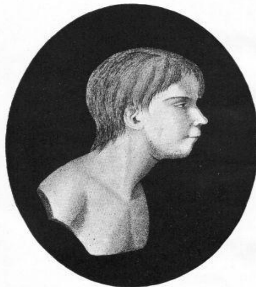
Der Wilde von Aveyron.