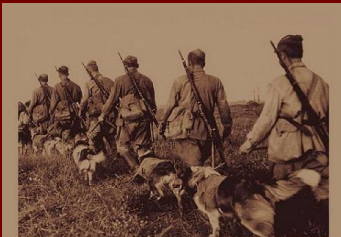
Фото 1942 года . Фронтные собаки -Бойцы со своими проводниками.

По всем военным дорогам прошли более 68 тысяч собак, которые внесли неоценимый вклад в дело Великой Победы над врагом.