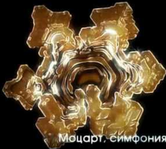
Моцарт, симфония №40