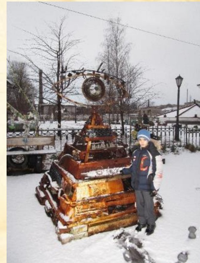
«Спасатель» автор Иванов

Работы выполнены из обломков железа собранного на фортах Кронштадта.