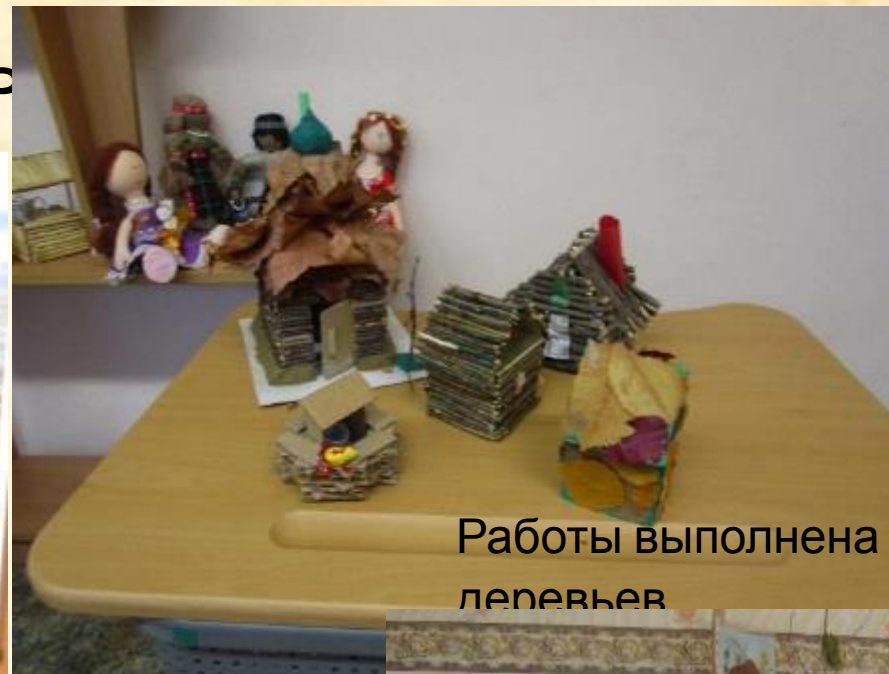
Работы выполнены из веток деревьев