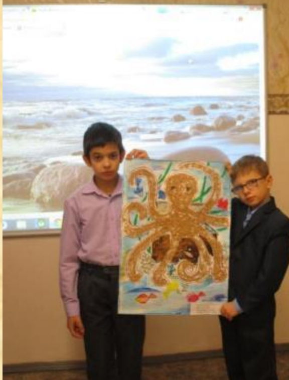
В работе использован речной песок.