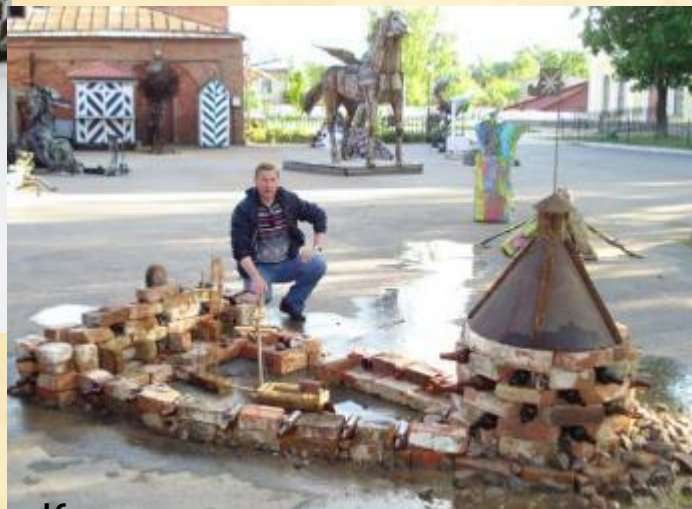
«Крепость» автор Виктор Андреев