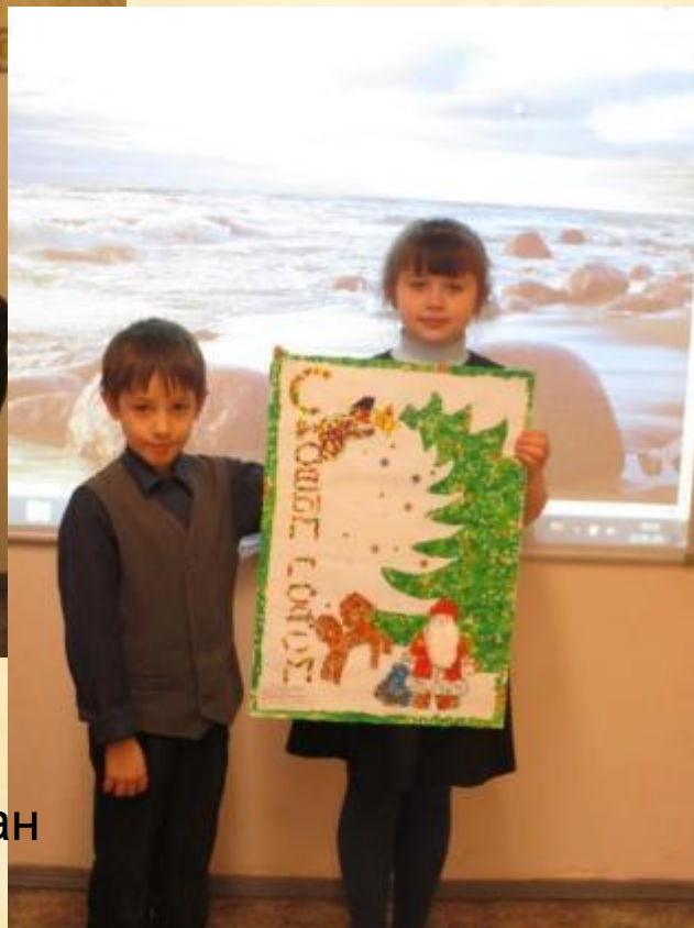
Работа выполнена из фантиков