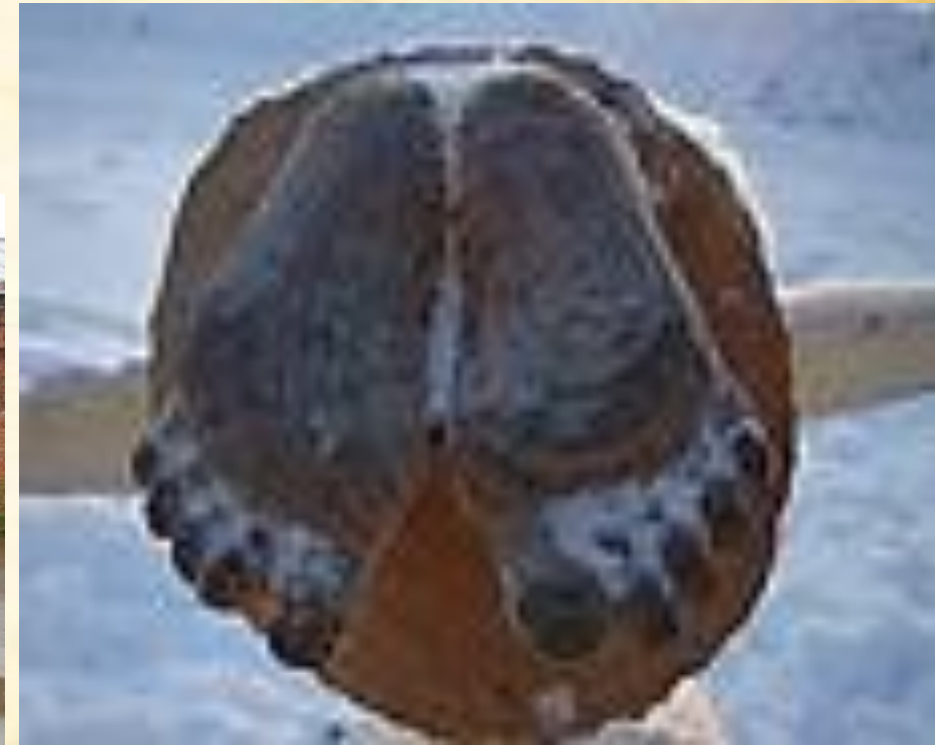
След на земле.