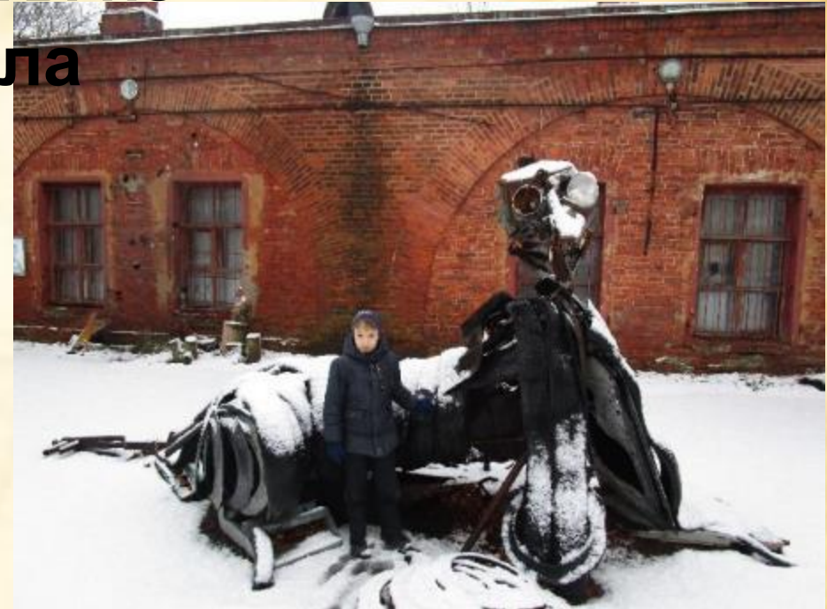
«Дракон» автор Лучиков

Все экспонаты этого зала сделаны из металлолома поднятого со дна Финского залива и собранного в прибрежной полосе о. Котлин.