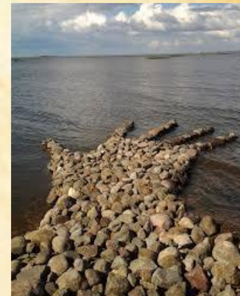
«Рука» автор Татьяна Премингер (Израиль)

«Кронфест» делает огромную, нужную людям работу. Но как грустно оттого, что наша прекрасная Земля всё больше покрывается слоем мусора... Давайте же все вместе беречь её.