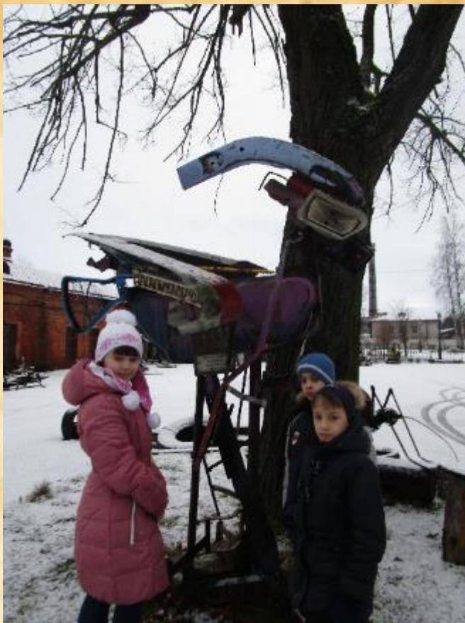
«Птица» автор Н. Маврин (Ульяновск)