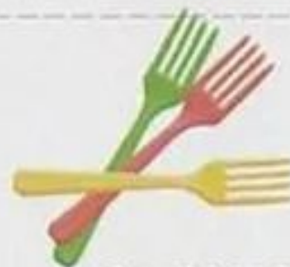
одноразовые столовые приборы