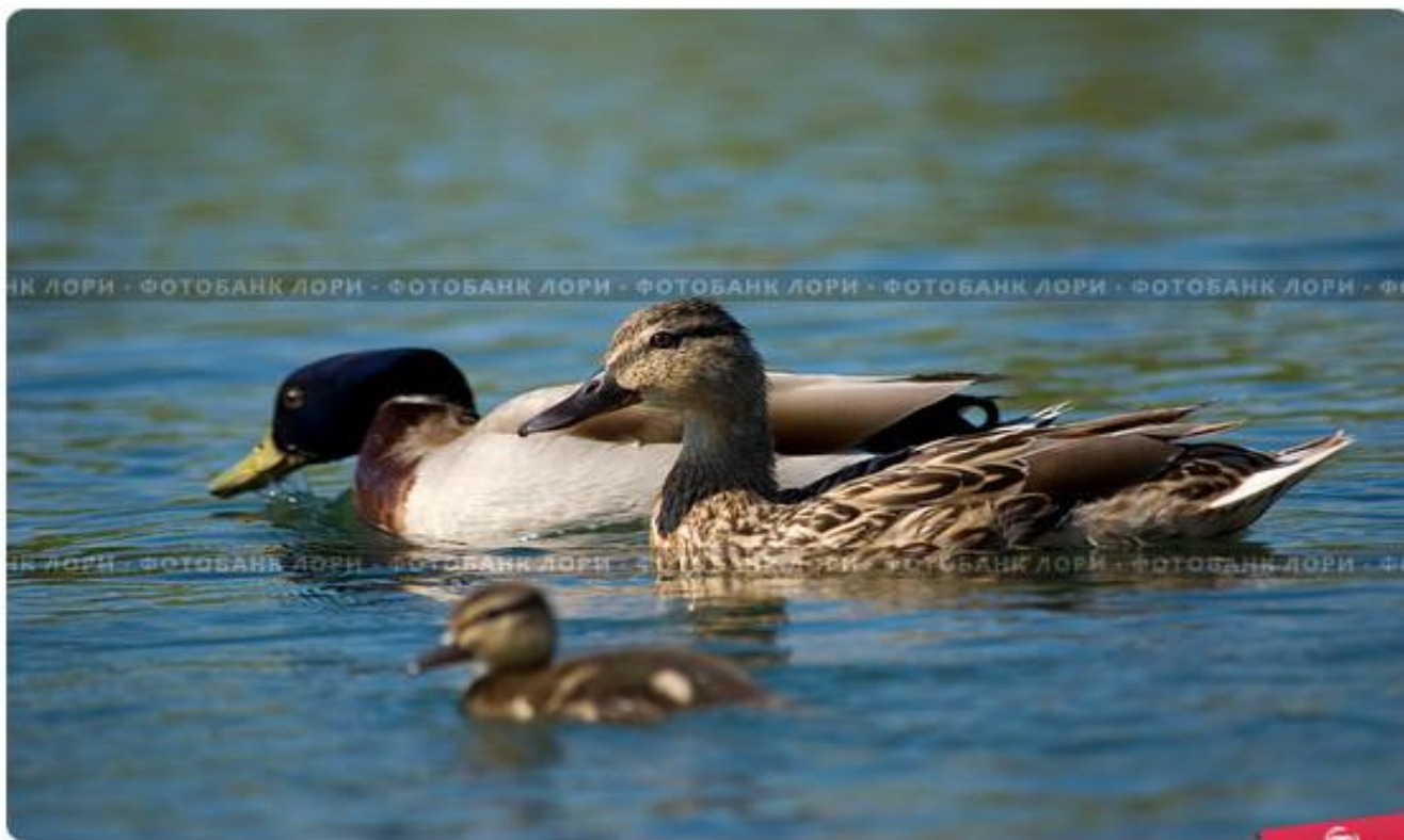
Селезень, утка и утенок