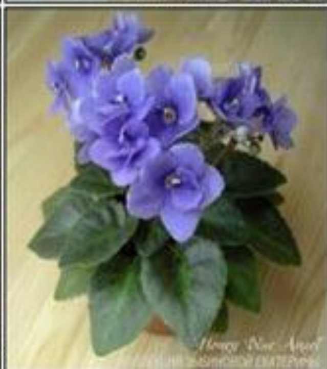
"Honey New Angel" КОЛЛЕКЦИЯ И ФОТО ЕКАТЕРИНЫ