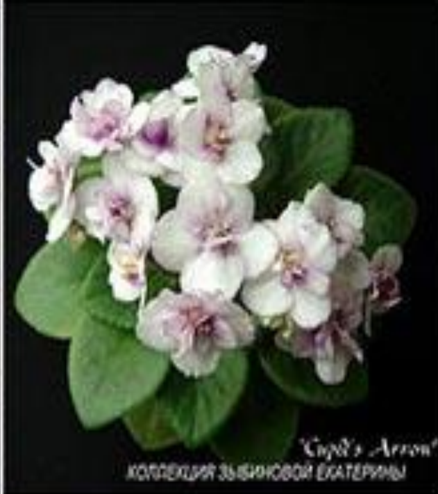
"Cupid's Arrow" КОЛЛЕКЦИЯ ЗЫБИНОВОЙ ЕКАТЕРИНЫ