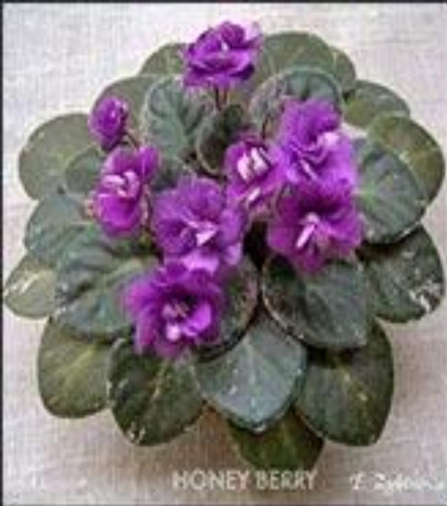
HONEY BERRY © E. Zybina