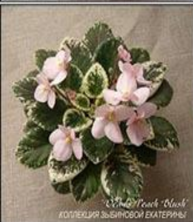
"Candy Peach Blush" КОЛЛЕКЦИЯ ЗЫБИНОВОЙ ЕКАТЕРИНЫ