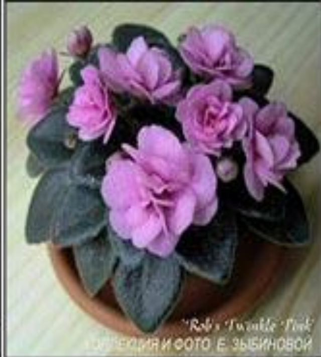
"Rob's Twinkle Pink" КОЛЛЕКЦИЯ И ФОТО Е. ЗЫБИНОВОЙ