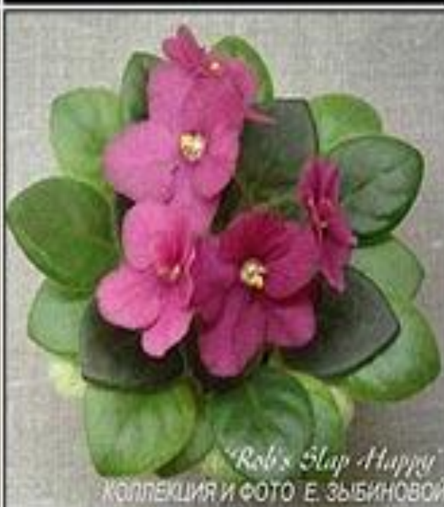
"Rob's Slap Happy"