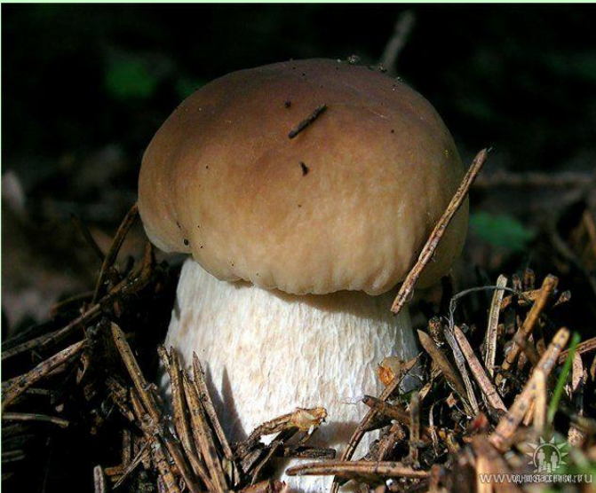
Белый гриб (боровик)