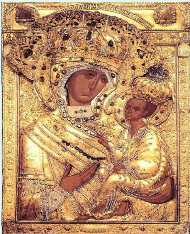
ИКОНА ВСЕХ СКОРБЯЩИХ РАДОСТЬ