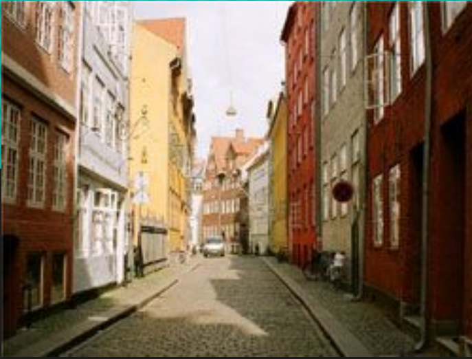
Пешеходная улица Строгет