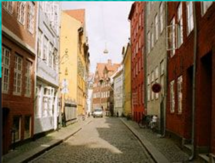
Пешеходная улица Строгет