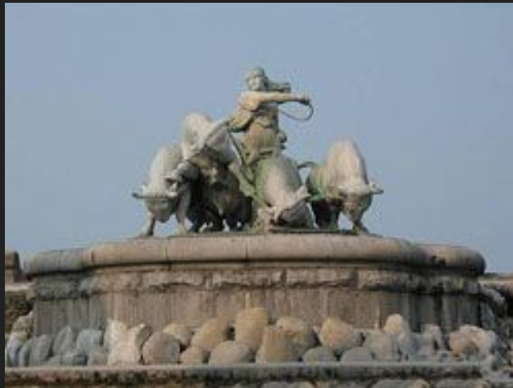
Фонтан на улице Копенгагена