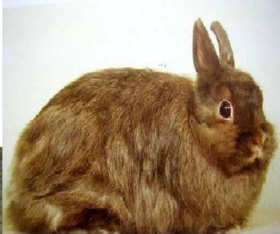
лисий карликовый кролик