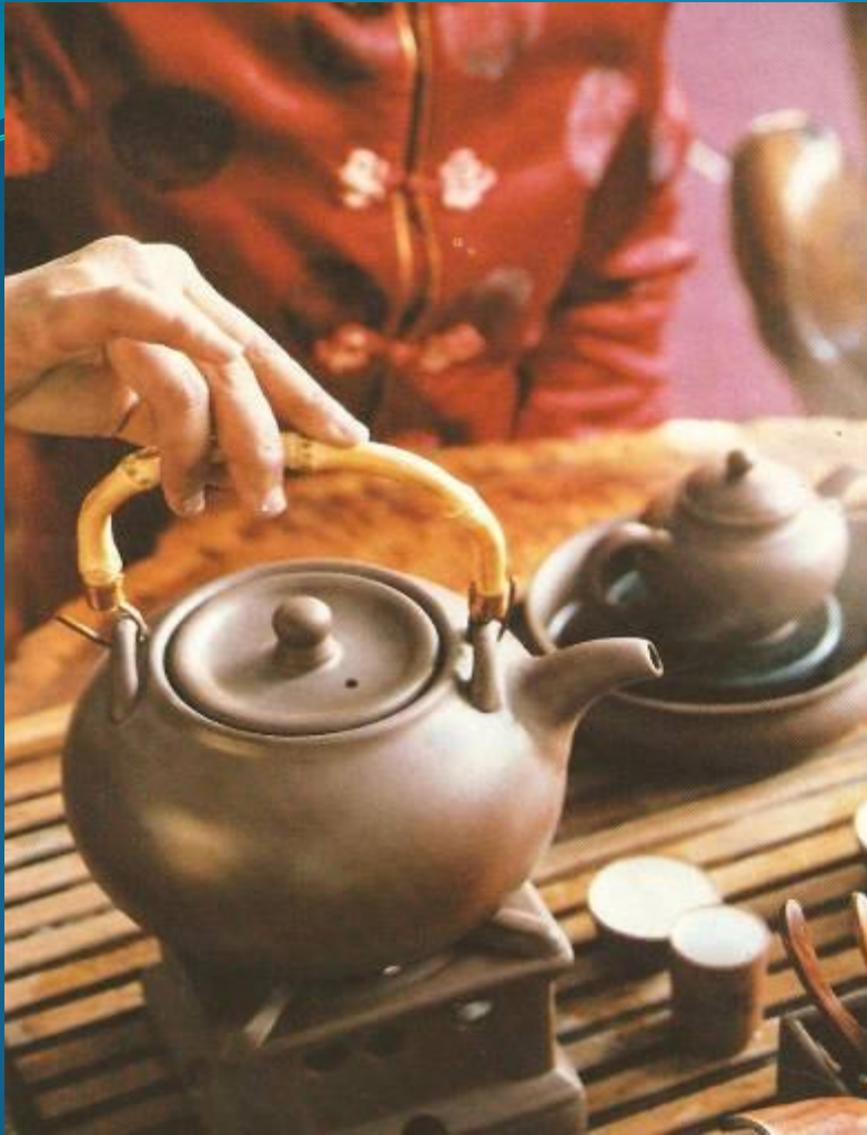
Чайник для кипячения, заварочный чайник