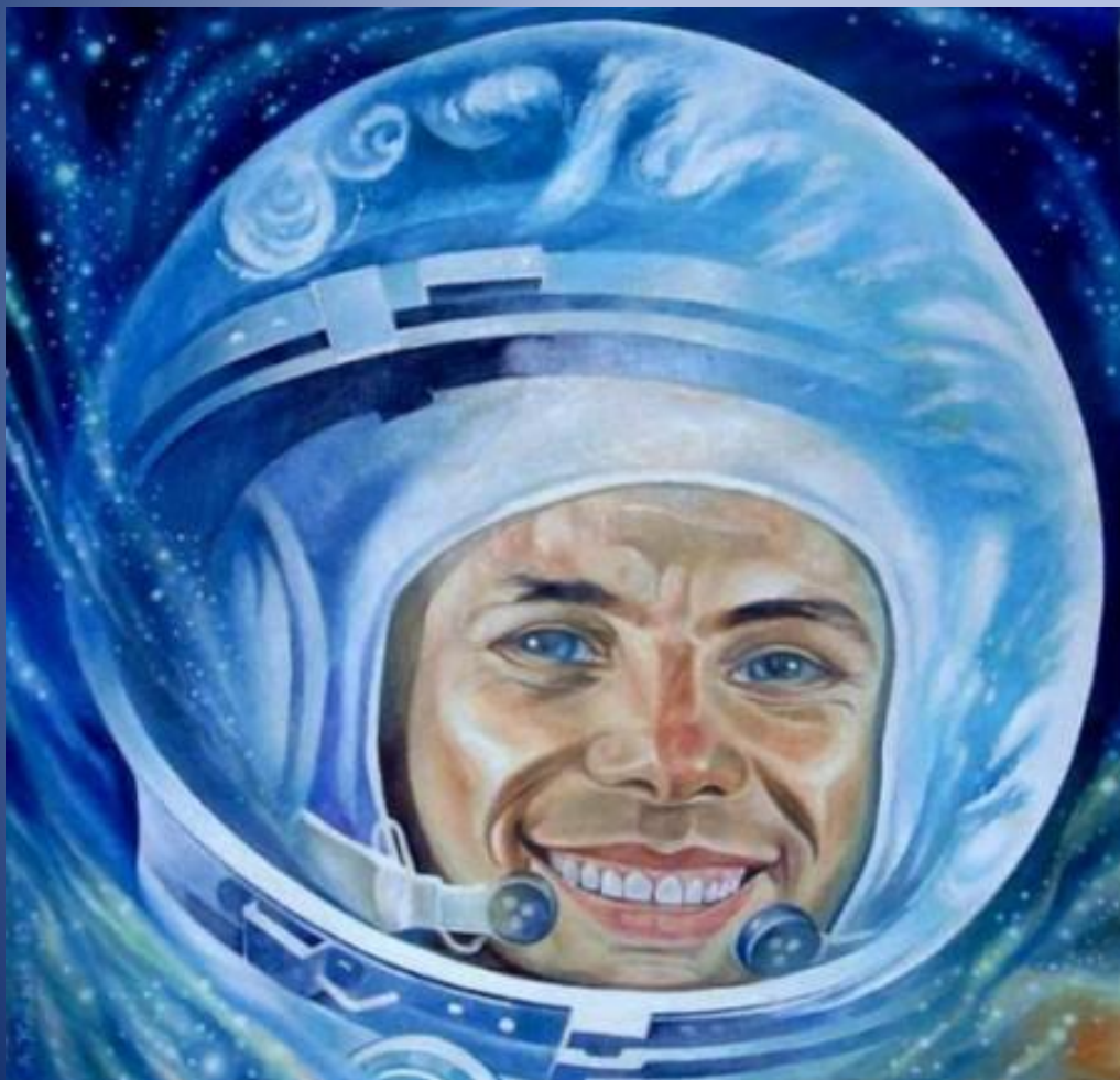
Юрий Алексеевич Гагарин (9.03.1934-27.03.1968)