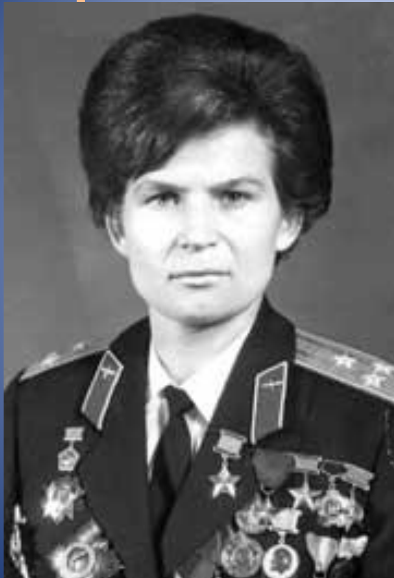
Валентина Владимировна Терешкова (6 марта 1937г.)