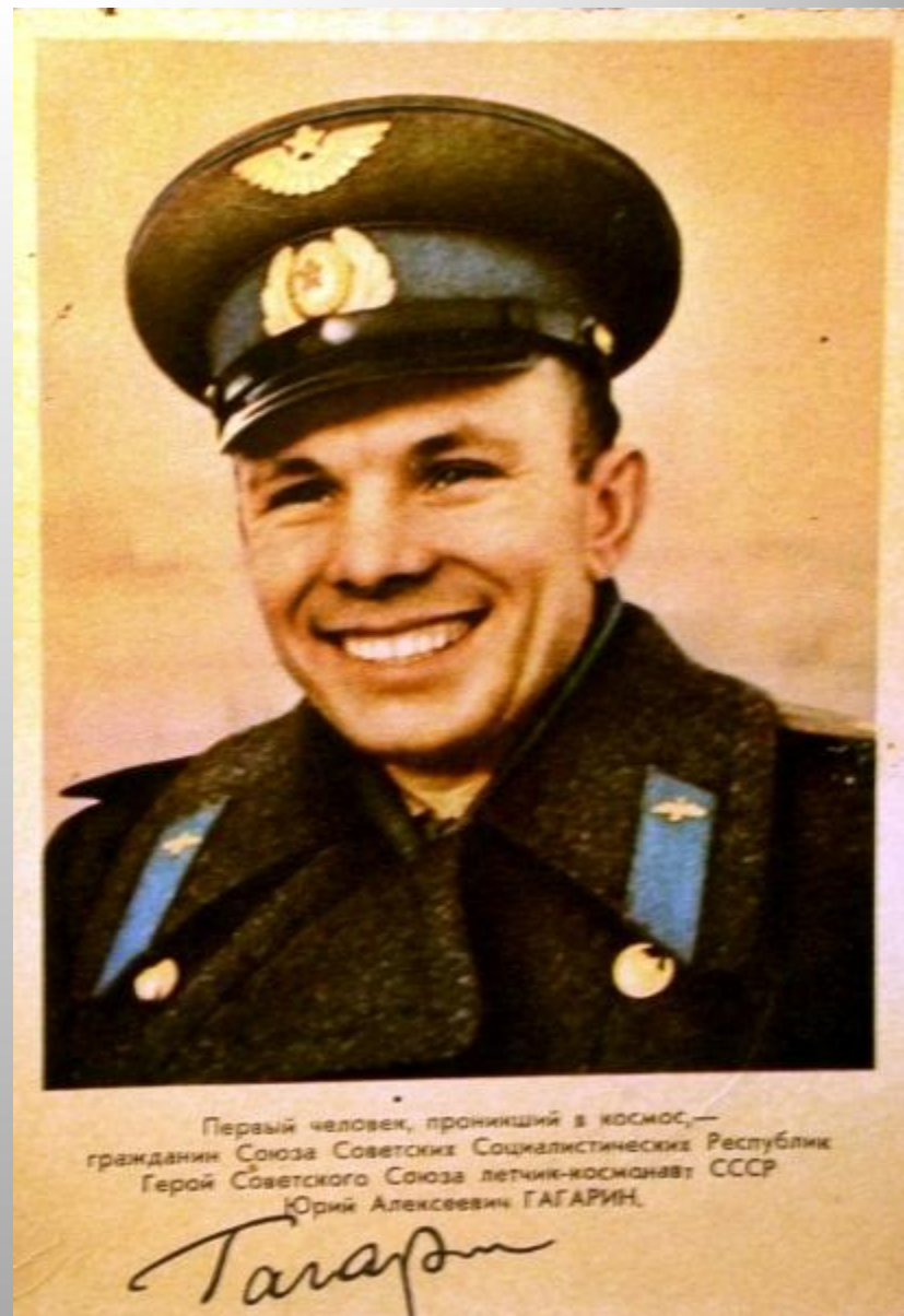
Первый человек, проникший в космос, — гражданин Союза Советских Социалистических Республик Герой Советского Союза летчик-космонавт СССР Юрий Алексеевич ГАГАРИН.

Не попросив подмог ни у кого, Сама восстав из пепла и из праха, Моя страна, не знающая страха, Шлет в космос ныне сына своего.