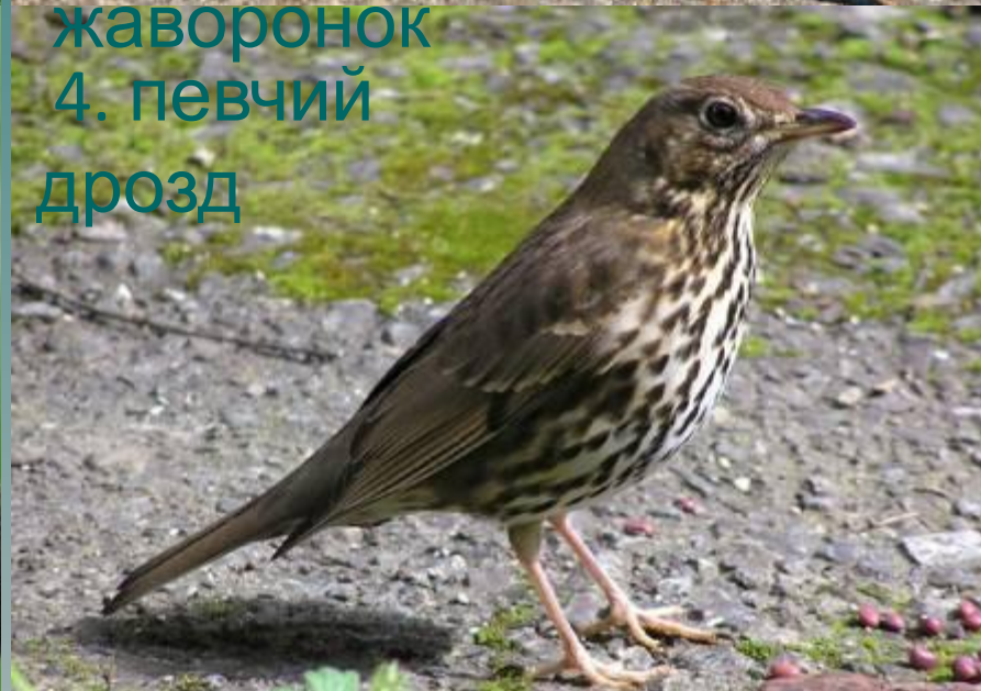
4. певчий дрозд