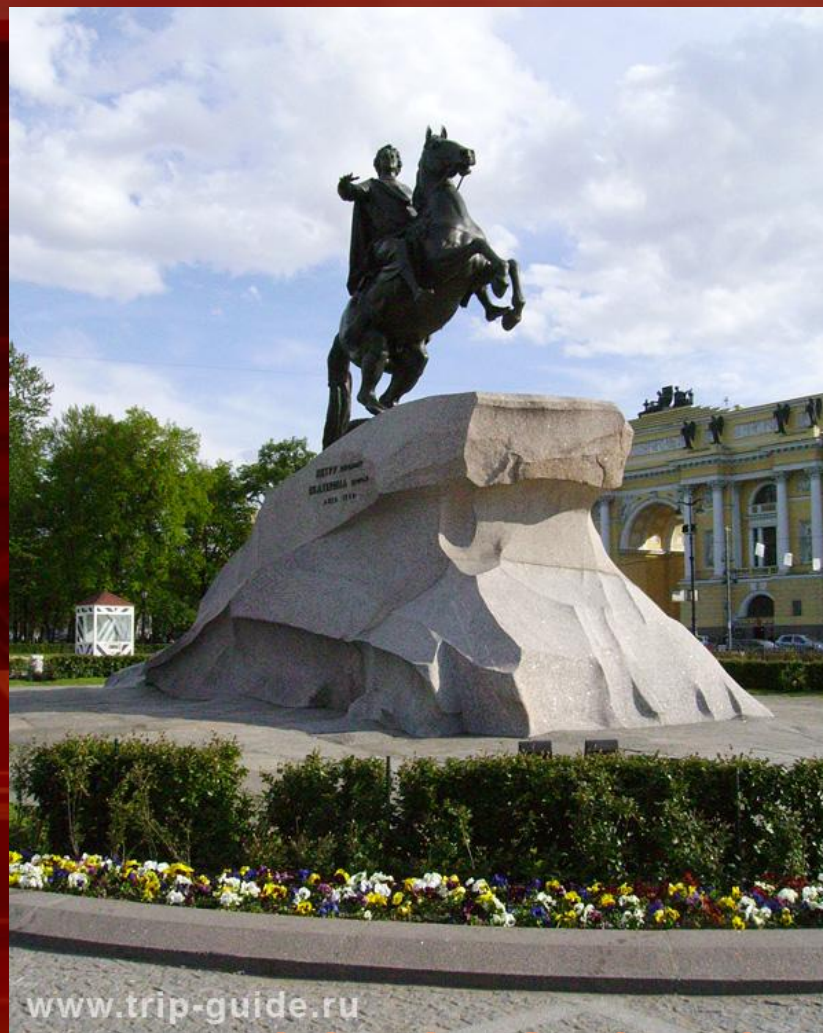
Памятник основателю города Петру I « Медный всадник »