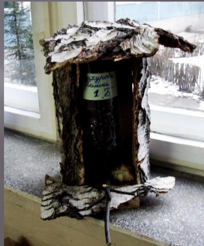
ШАХУРОВА ПОЛИНА, 1 «Б»