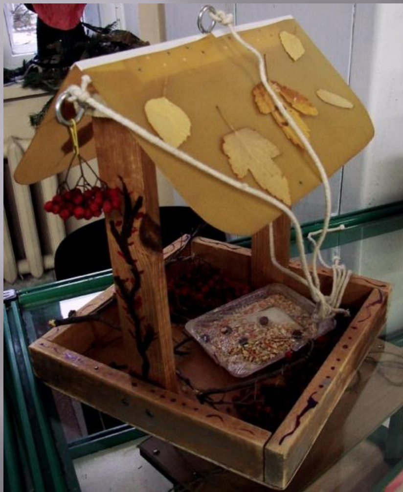
БАЖАН ДЕНИС, 1 «В»