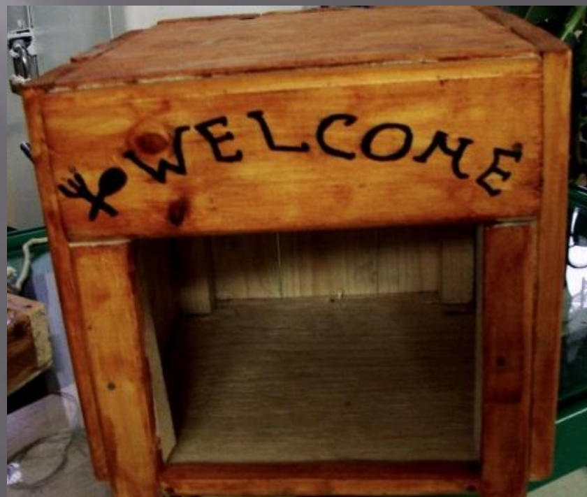
ЛЕОНОВ НИКИТА, 3 «Г»