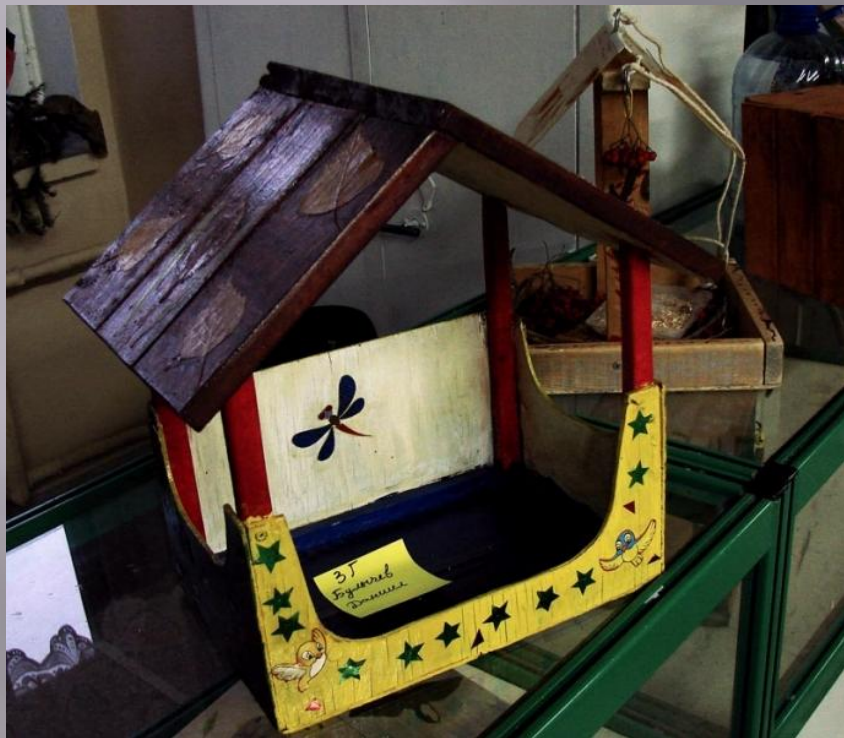
БУЛЫЧЕВ ДАНИИЛ, 3 «Г»