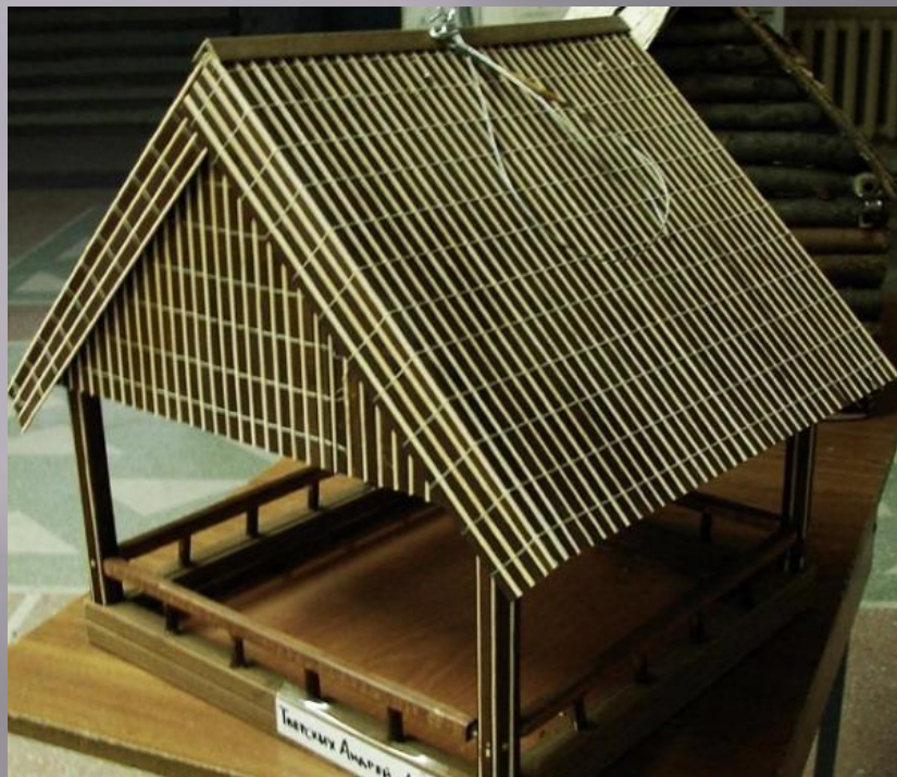
ТВЕРСКИХ АНДРЕЙ, 1 «Г»