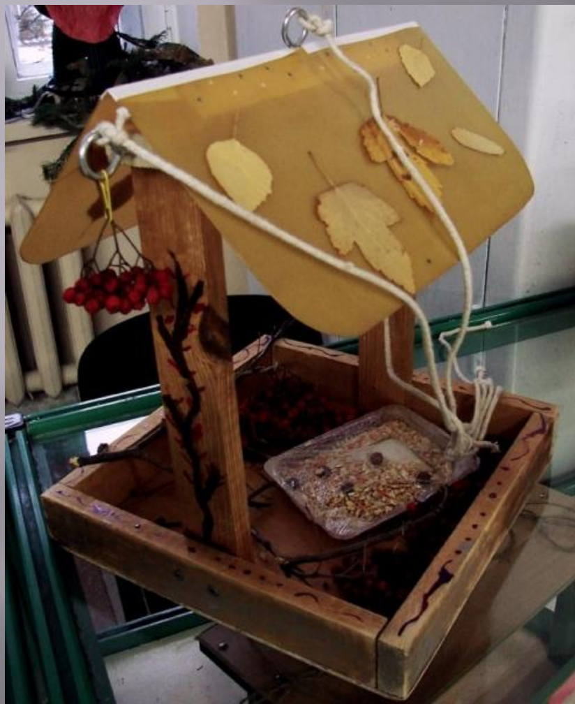
БАЖАН ДЕНИС, 1 «В»