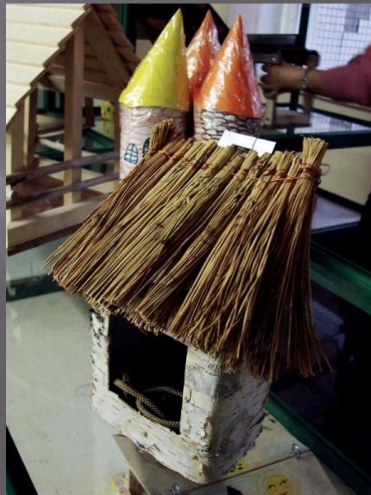
ТВЕРДОХЛЕБОВ А, 2 «В»