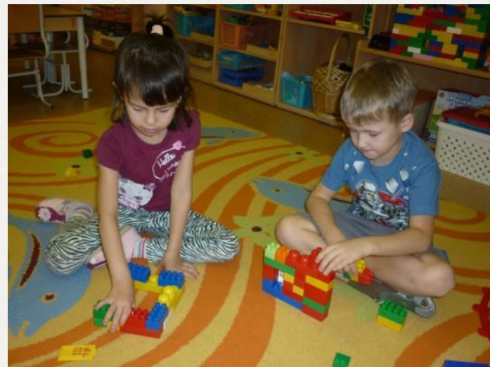
Лего-конструирование: «Волшебный город»