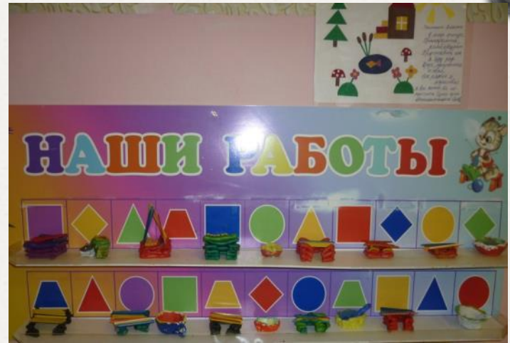
Лепим: «Мой дом»