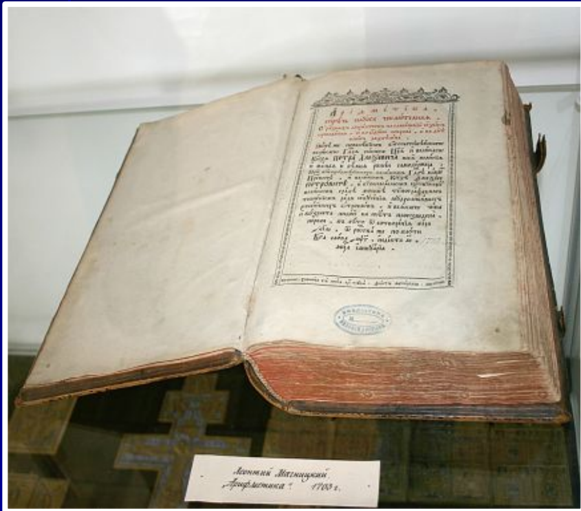
Леонтий Магницкий «Арифметика» 1703 г.