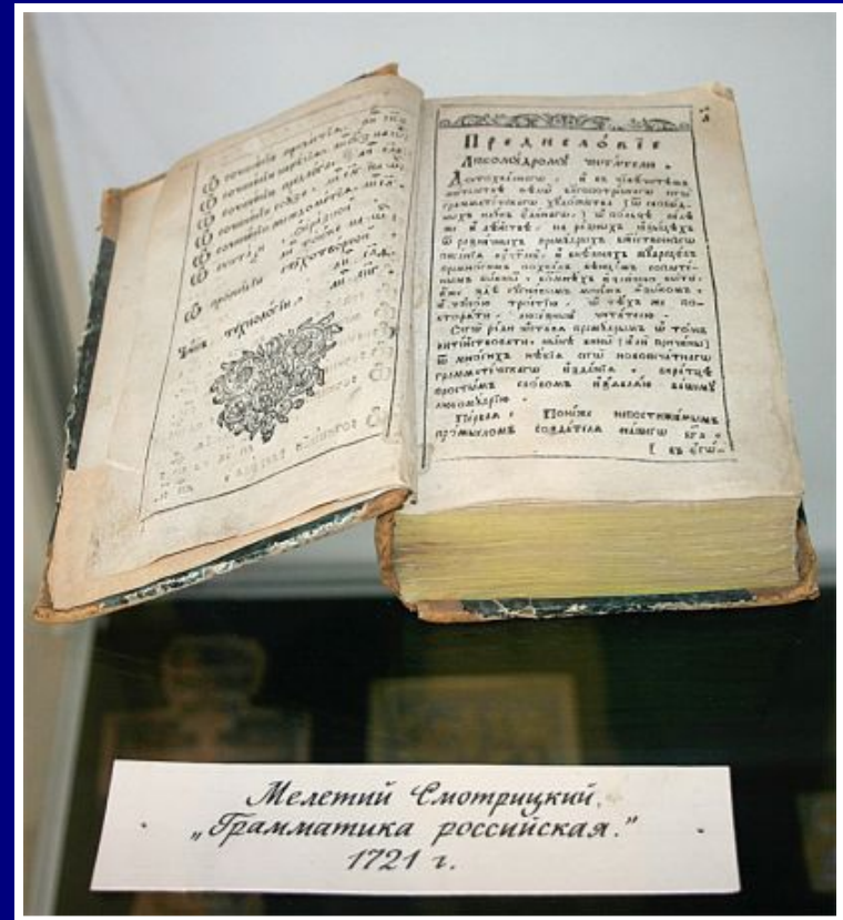
Мелетий Смотрицкий «Грамматика российская» 1721 г.