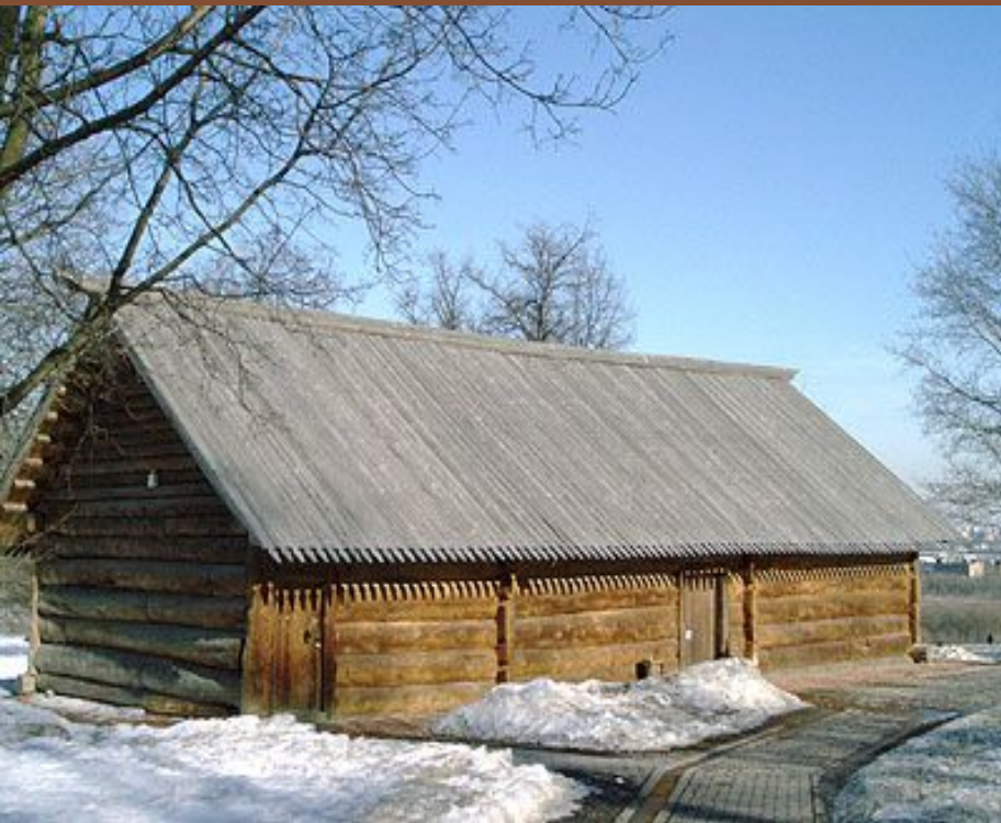
Хозяйственная постройка Петра I в селе Преображенском

После того как состоялась торжественная церемония венчания на царство царевичей, наречённых царями Иваном V и Петром I, правительница Софья, подозревавшая Наталью Кирилловну в интригах, вынудила её вместе с Петром покинуть Москву. Царица Наталья обосновалась в подмосковном дворце в селе Преображенском. В Преображенском Пётр пользовался полной свободой. Пётр с ватагой сверстников из дворовых слуг убегал в окрестные поля и леса. На вольном воздухе он физически окреп, на время, забыв пережитое.