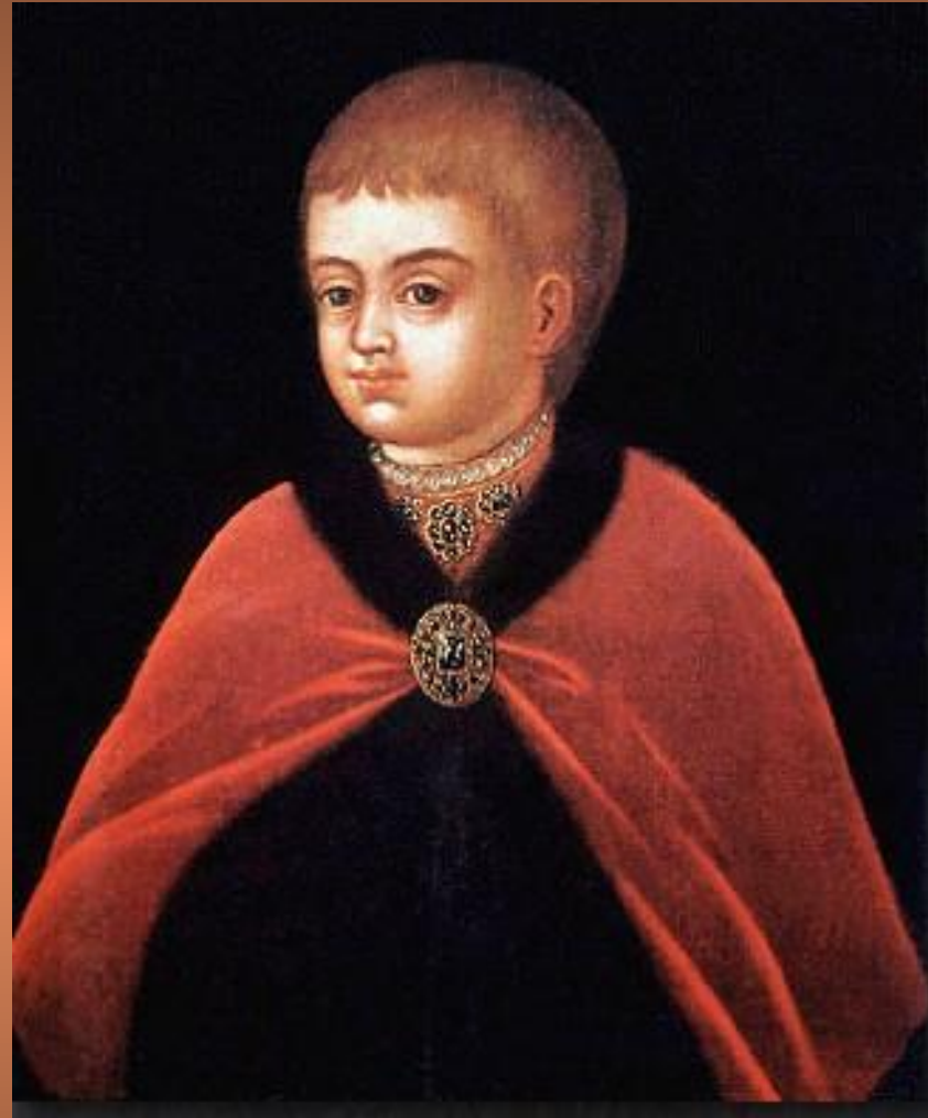
Петр в детстве

Со временем у царицы появились и другие дети, а к Петру были приставлены мамки и няньки, но Наталья Кирилловна ни на миг не отпускала от себя своего любимца. Малыша развлекали погремушками, а он тянулся к солдатикам, конькам и пушечкам. Когда Петру исполнилось три года, отец подарил ему детские ружье и сабельку. Благодаря первым годам жизни, проведённым в материнской горенке, Пётр навсегда полюбил небольшие, уютные комнаты с низкими потолками и маленькими оконцами.