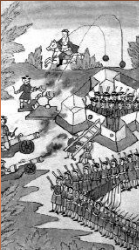
Петр в селе Преображенском

Обследовав кладовые Преображенского, Пётр обнаружил в них ржавые ружья и пистолы. Он одел и вооружил своё войско, состоявшее из сверстников и друзей по играм и потехам. Постепенно мальчишеская забава превращалась в серьёзное увлечение. Пётр собрал в своём войске молодых людей из боярских семей и взрослых мужчин из числа оставшихся не у дел знатных придворных родов. В 1687г. К Петру явилось столько желающих что ему удалось составить из них два полка, один из которых разместился в Преображенском, а второй - в селе Семёновском. Со временем для них сшили специальную форму: для преображенцев - зелёную, а для семёновцев - синюю. Мундиры были сшиты по европейскому образцу.