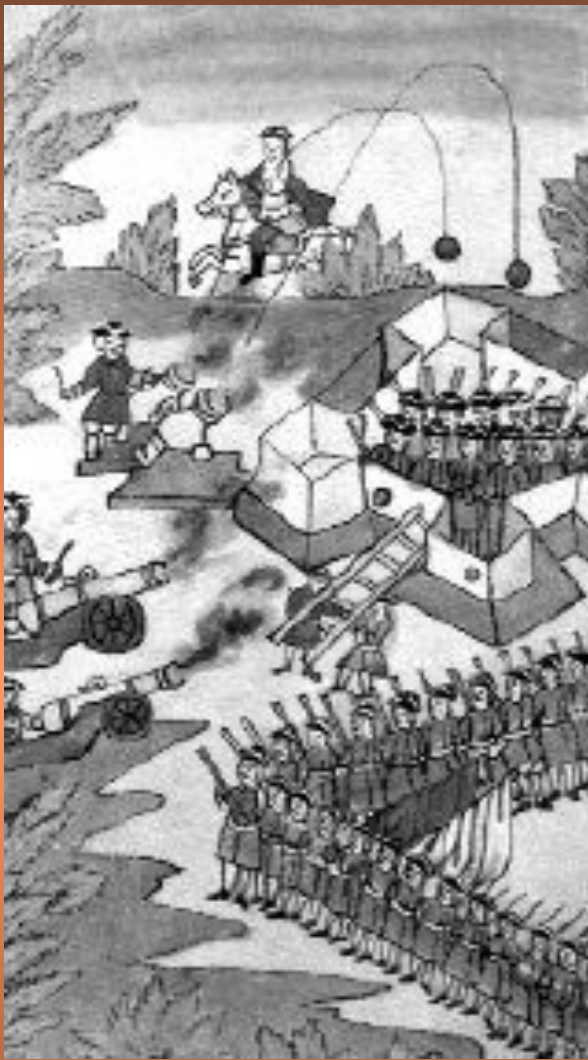
Петр в селе Преображенском

Обследовав кладовые Преображенского, Пётр обнаружил в них ржавые ружья и пистолы. Он одел и вооружил своё войско, состоявшее из сверстников и друзей по играм и потехам. Постепенно мальчишеская забава превращалась в серьёзное увлечение. Пётр собрал в своём войске молодых людей из боярских семей и взрослых мужчин из числа оставшихся не у дел знатных придворных родов. В 1687г. К Петру явилось столько желающих что ему удалось составить из них два полка, один из которых разместился в Преображенском, а второй - в селе Семёновском. Со временем для них сшили специальную форму: для преображенцев - зелёную, а для семёновцев - синюю. Мундиры были сшиты по европейскому образцу.