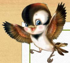
Воробей полевой (деревенский)