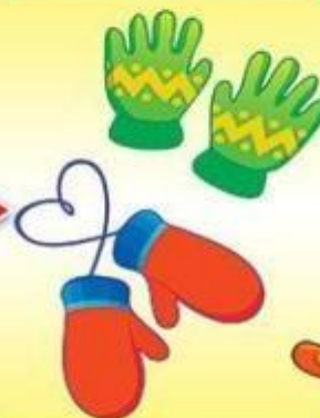
перчатки или варежки