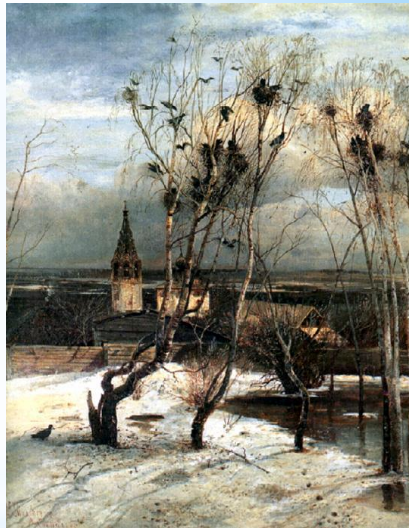
Грачи прилетели. А.К.Саврасов