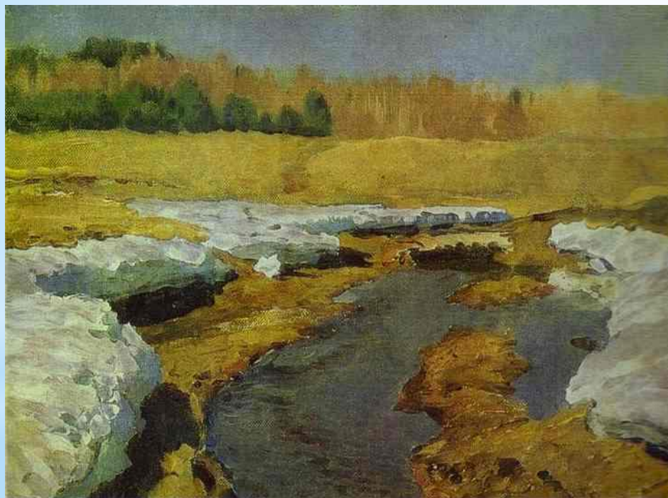
Весенняя пора. Последний снег. Левитан

Последним снегом пахнет И первою травой. Защебетали птахи Над самой головой.