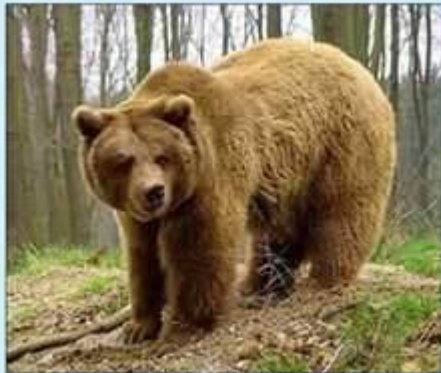
В лесу живут разные животные. Послушай, как рычит бурый МЕДВЕДЬ.