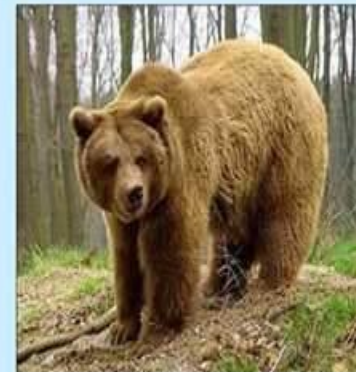
В лесу живут разные животные. Послушай, как рычит бурый МЕДВЕДЬ.