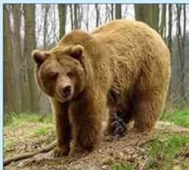
В лесу живут разные животные. Послушай, как рычит бурый МЕДВЕДЬ.