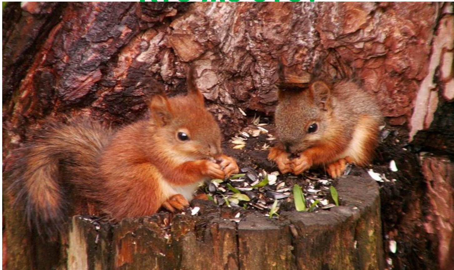
Белка и бельчонок

На ветке не птичка – Зверек-невеличка, Мех теплый, как грелка. Кто же это?