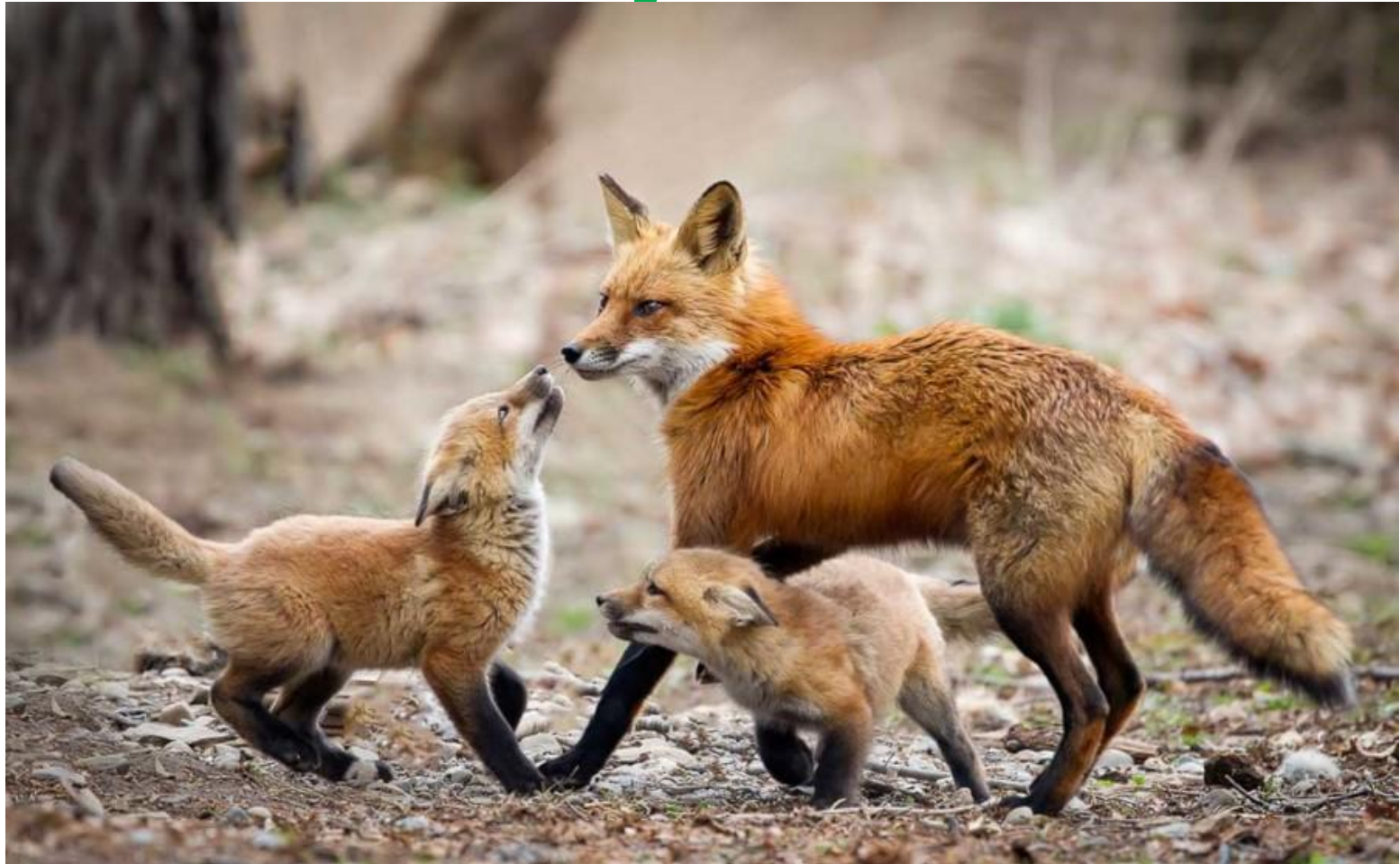
Лиса и лисята