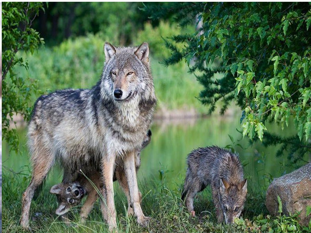
Волчица с волчатами