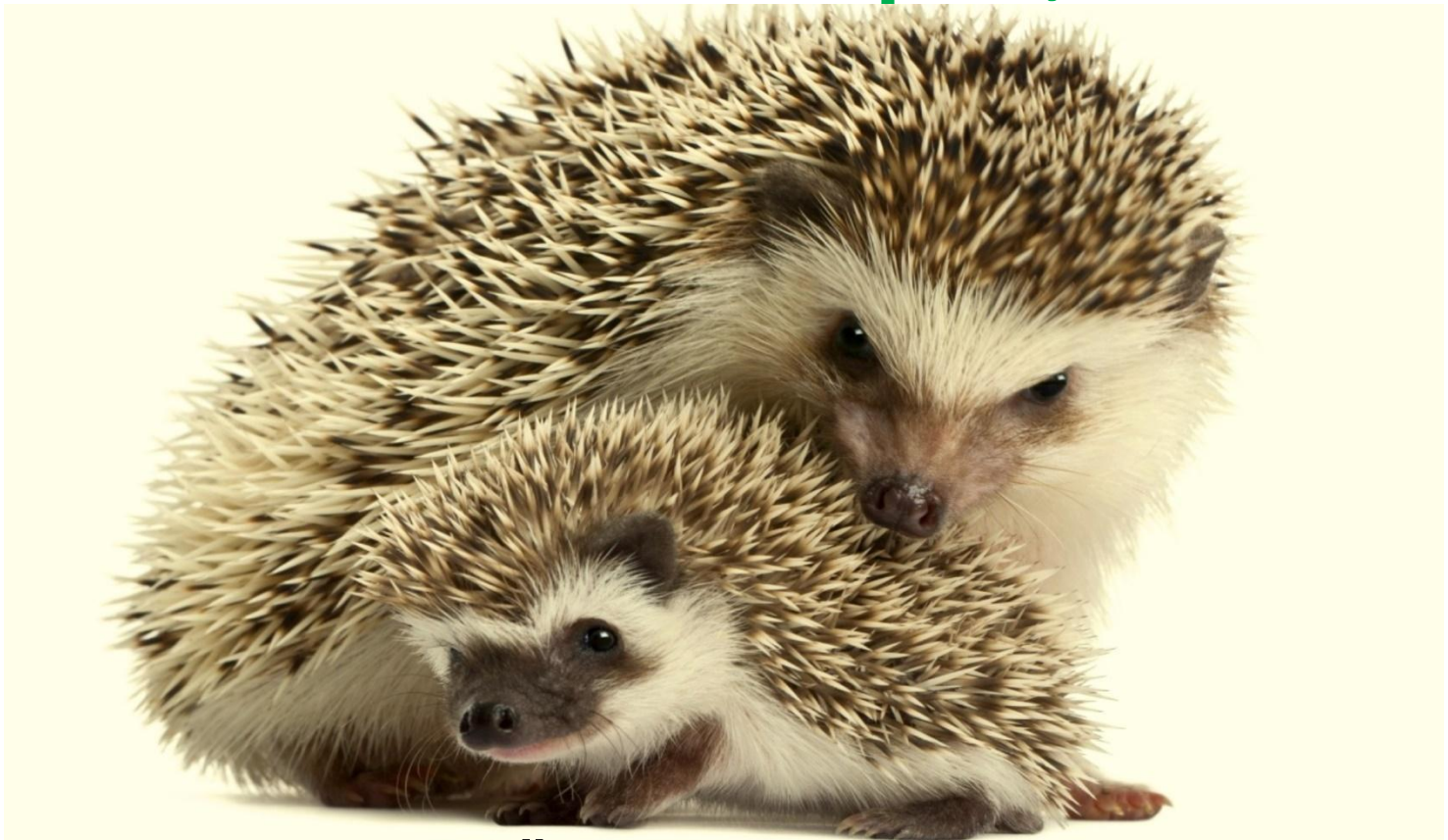
Ёж и ежонок