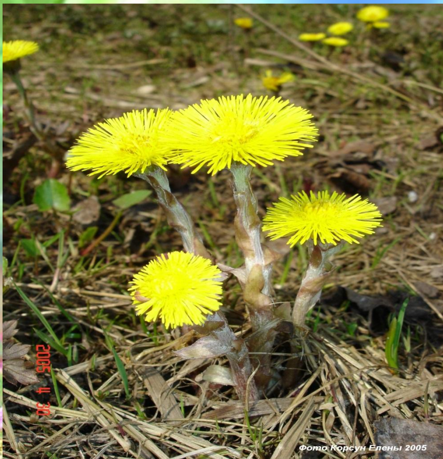
Фото Корсун Елены 2005