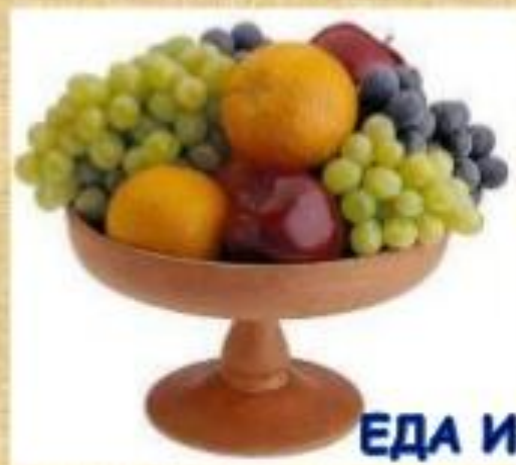
ЕДА И НАПИТКИ