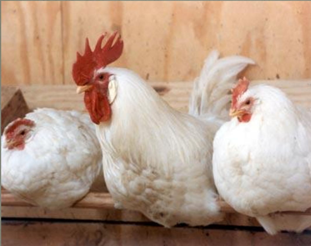
Русская белая порода кур.

Домашние куры очень разнообразны. Человек вывел около 100 пород кур. Одни несут много яиц, другие дают много мяса, третьи дают много яиц и мяса.