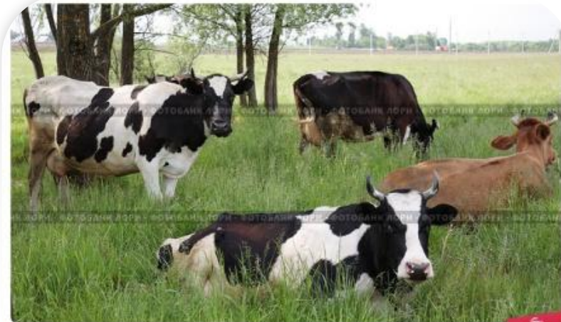
Коровы на лугу