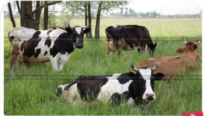
Коровы на лугу