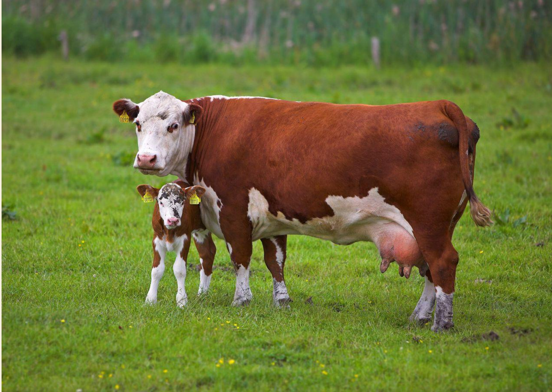
КОРОВА С ТЕЛЕНКОМ