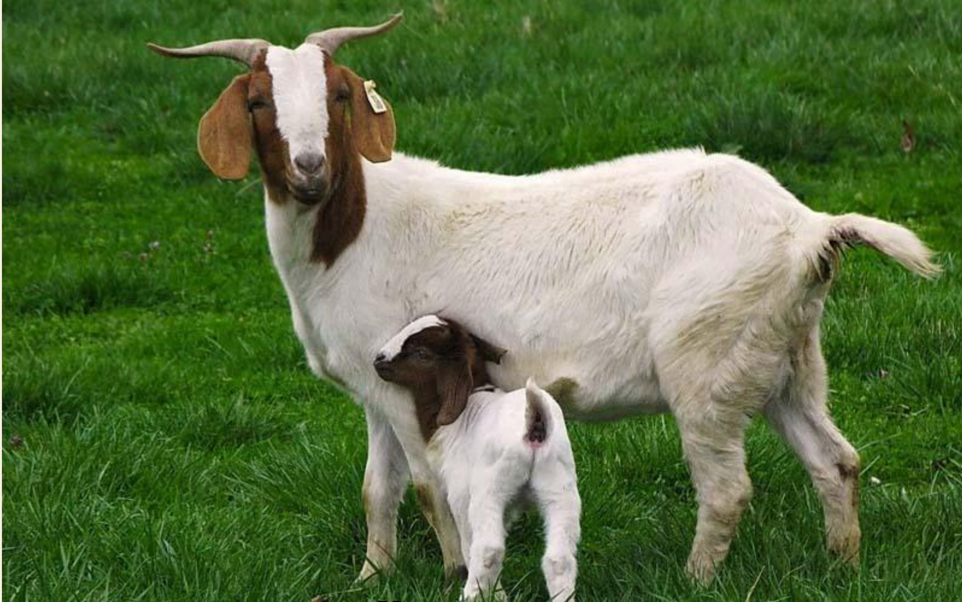
КОЗА С КОЗЛЁНКОМ