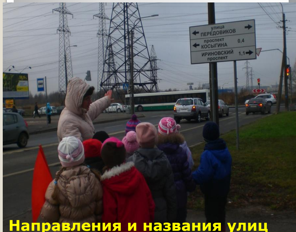
Направления и названия улиц