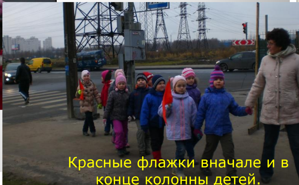
Красные флажки вначале и в конце колонны детей.