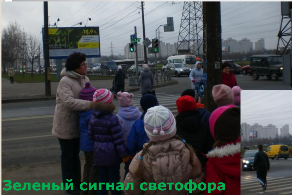
Зеленый сигнал светофора