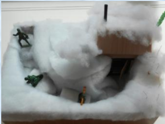
Макет военной землянки