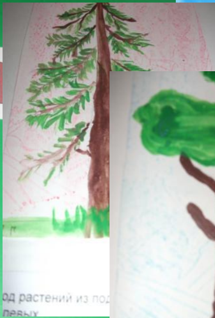
род растений из под левы.