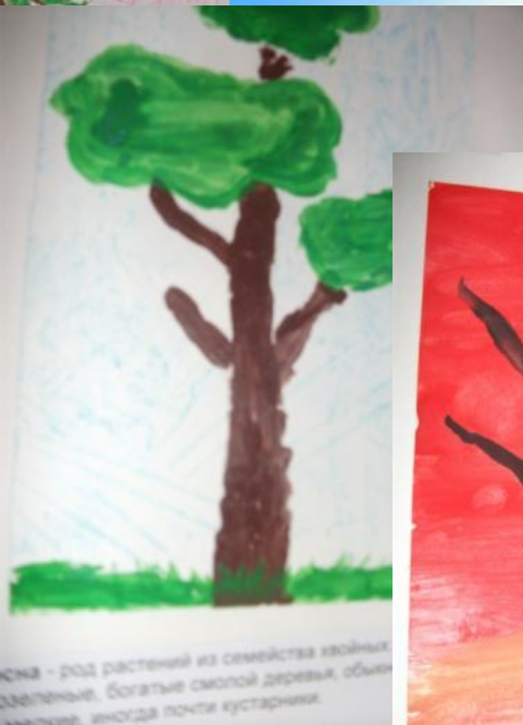
сна - род растений из семейства хвойных зеленые, богатые смолой деревья, обыкновенные мелкие, иногда почти кустарники.