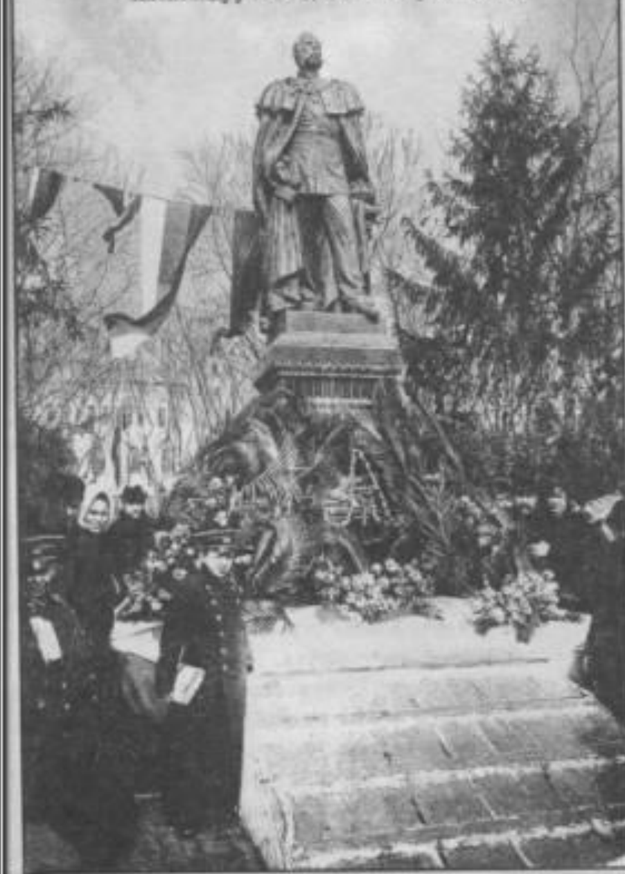
Астрахань. Памятник Царю-Освободителю Александру II въ день 19 Февраля. 1911 г.

Александр II был изображён на гранитном постаменте в ниспадающей порфире, со свитком. На пьедестале золотом были начертаны слова: "Царю-освободителю", у подножия памятника стояли четыре бронзовых орла.