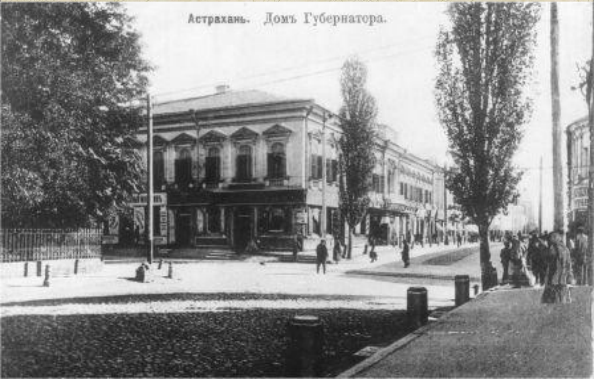
Астрахань. Домъ Губернатора.

А позднее с появлением дома Генерал-Губернатора на одном её крае –