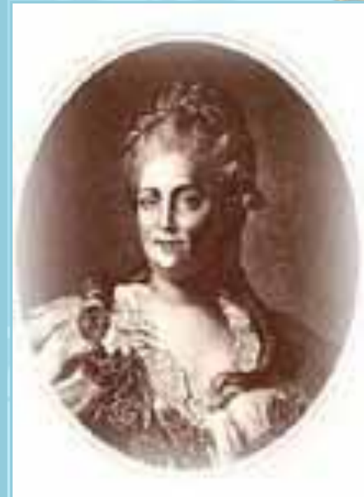
Екатери на Великая

Он взял на себя обязательство закончить работу над памятником за 8 лет. После отливки модели из бронзы стали искать камень для подножия памятника. Постамент хотели сделать из цельной глыбы.