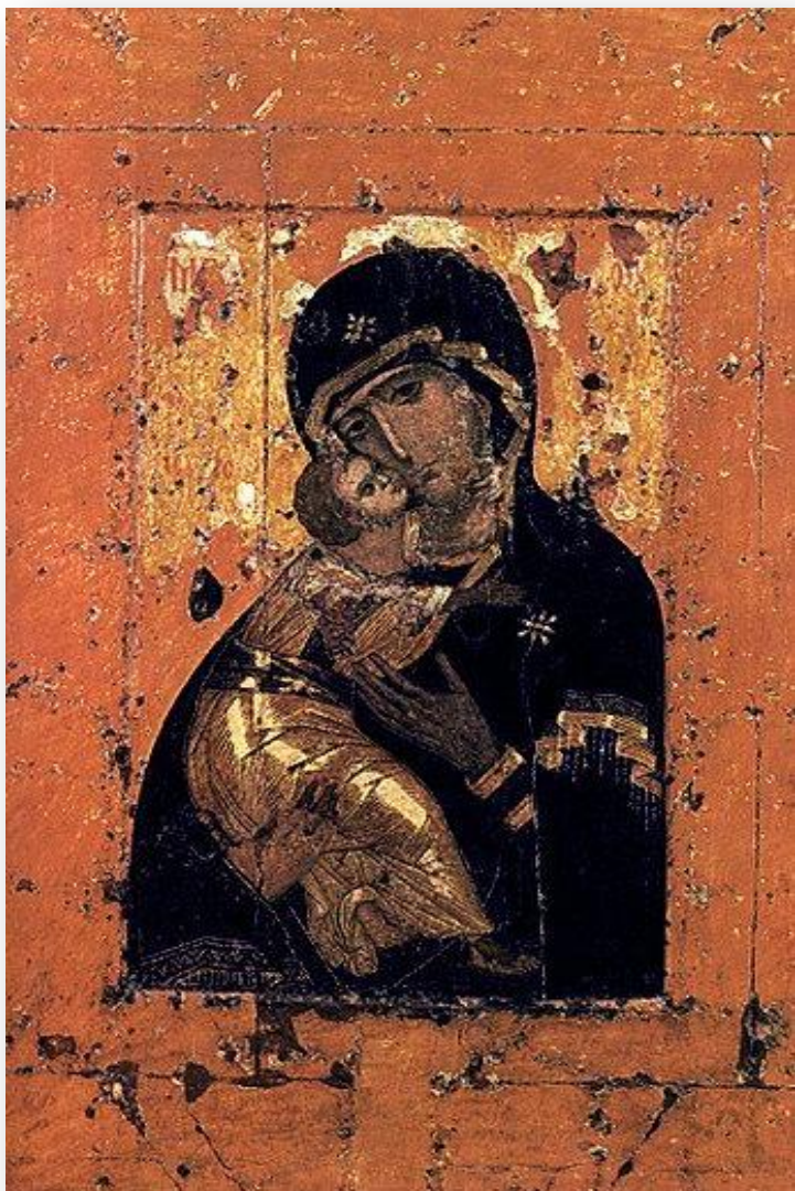
Владимирская икона Божьей матери XII век