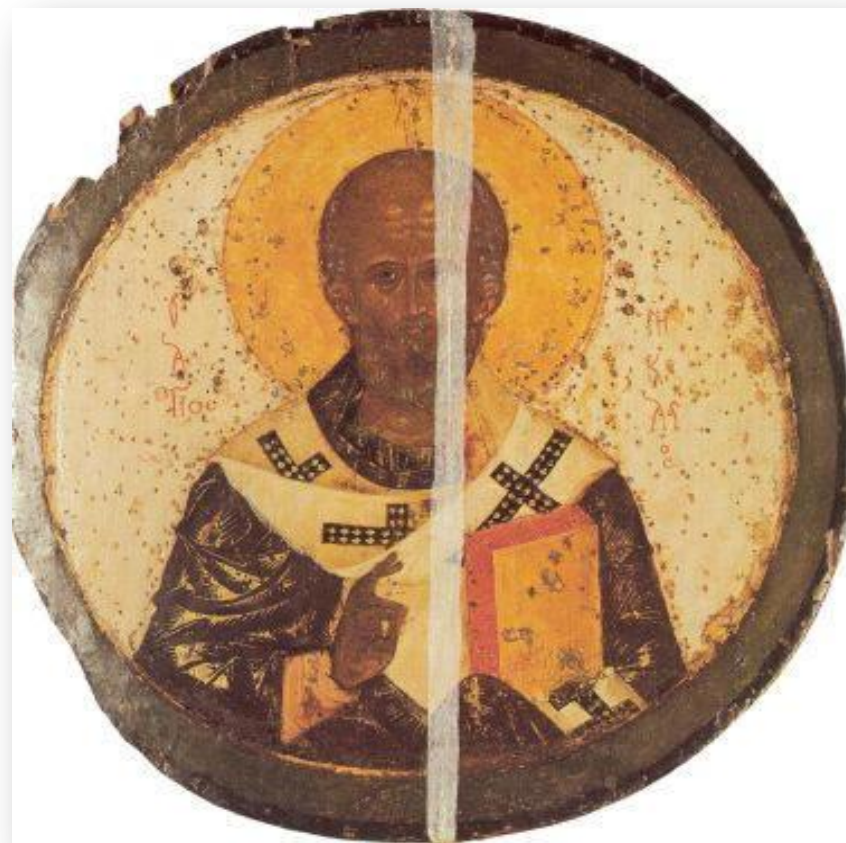
Святитель Николай, Новгород XII век