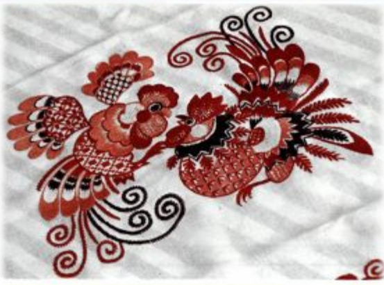
1307146 — Вологодский музей-заповедник Вышнего. Фрагмент вышивки «Вологодский петух» (Владимирский собор).