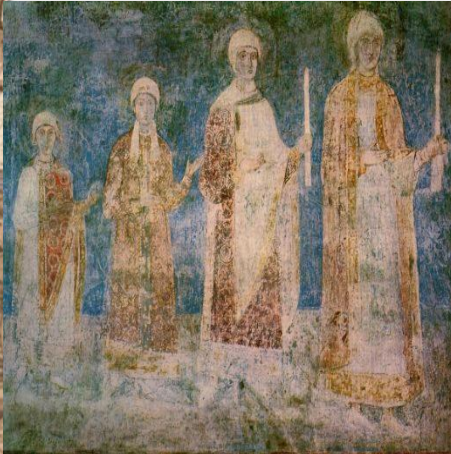
Семейство Ярослава Мудрого Киев, Святая София, XI век