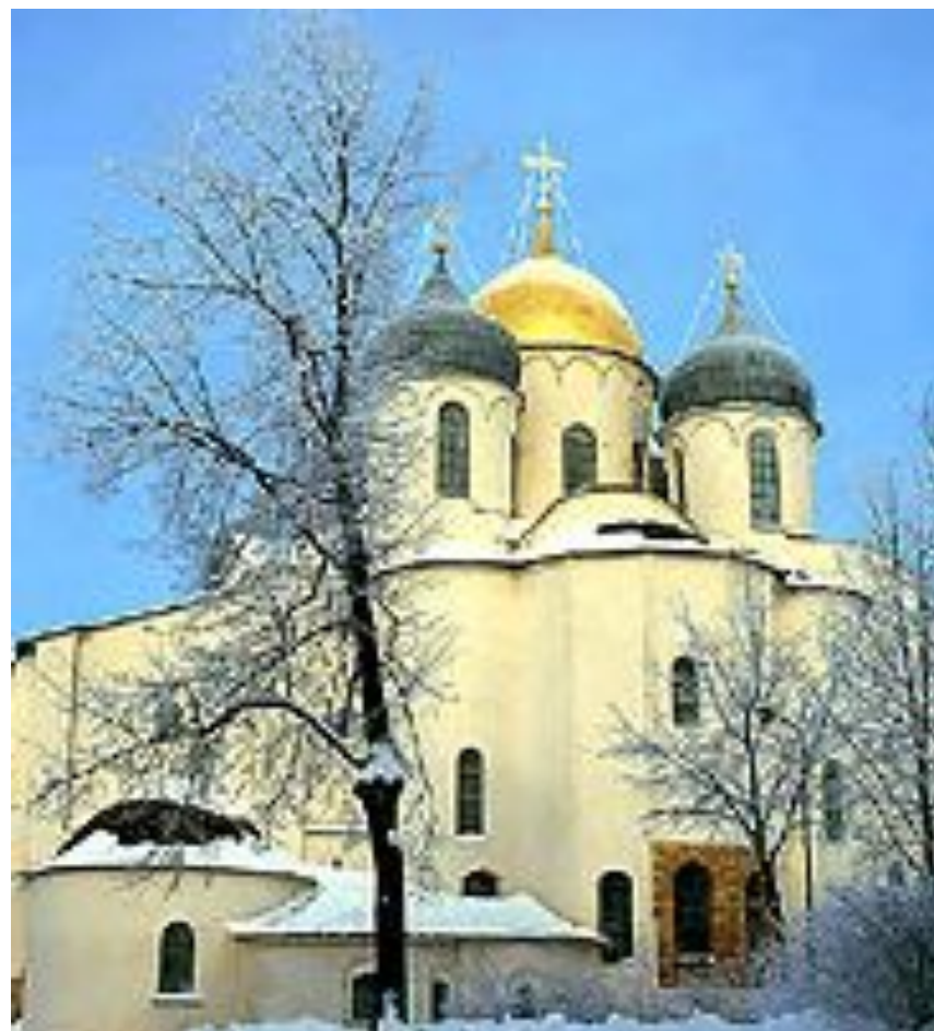
Софийский собор в Новгороде