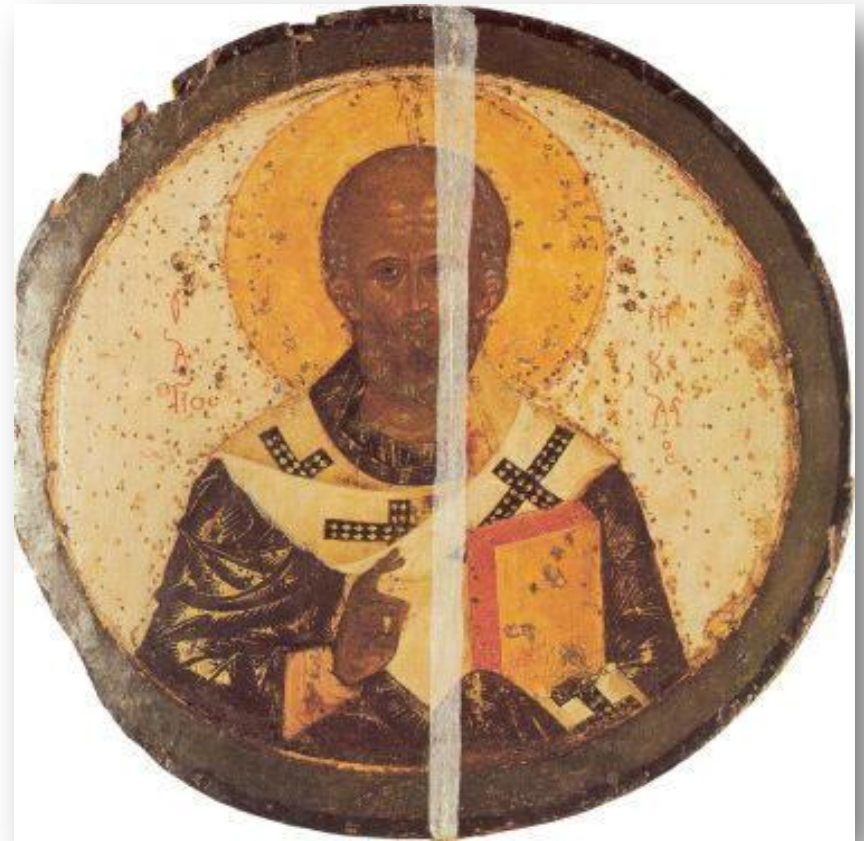
Святитель Николай, Новгород XII век