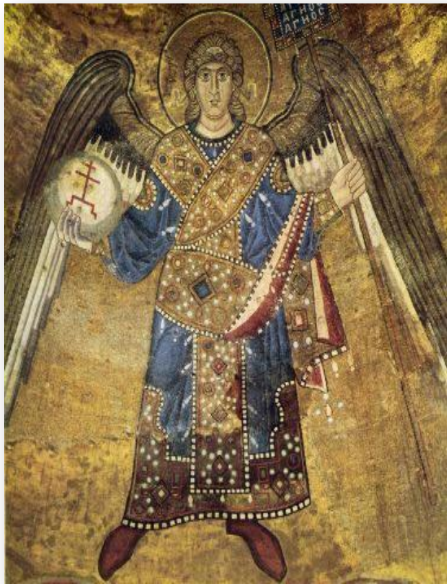
Архангел Киев, Святая София, XI век

МОЗАИКА – рисунок или узор из скрепленных между собой разноцветных камешков, кусочков стекла.