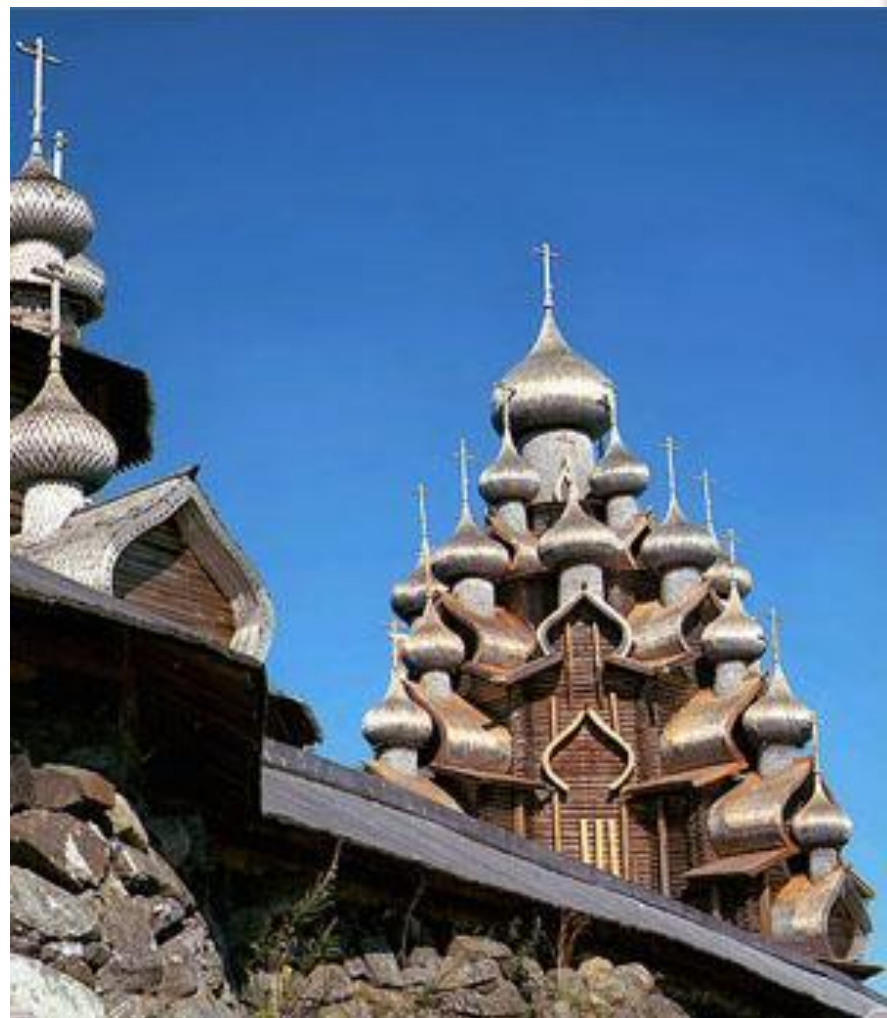
Купола Преображенской церкви