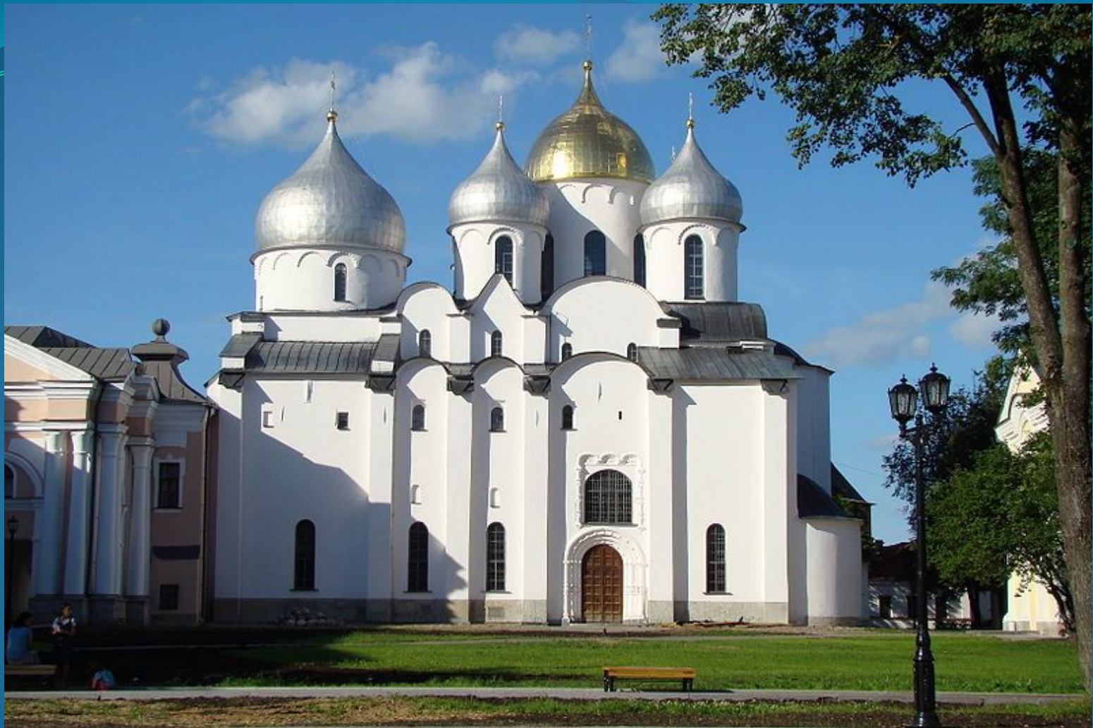
Софийский собор 1045 -1050