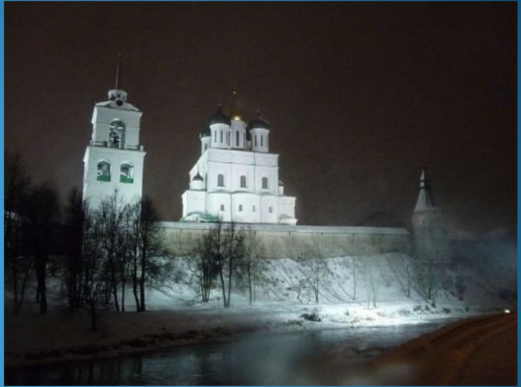
Свято-Троицкий кафедральный собор