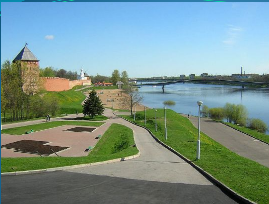
Вид на восточную стену Детинца и Волхов от Монумента Победы

Великий Новгород - город на северо-западе России, административный центр Новгородской области, Город воинской славы.