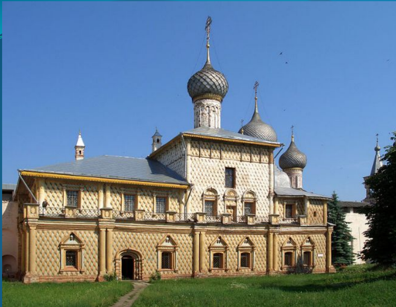
Церковь иконы Божией Матери «Одигитрия»