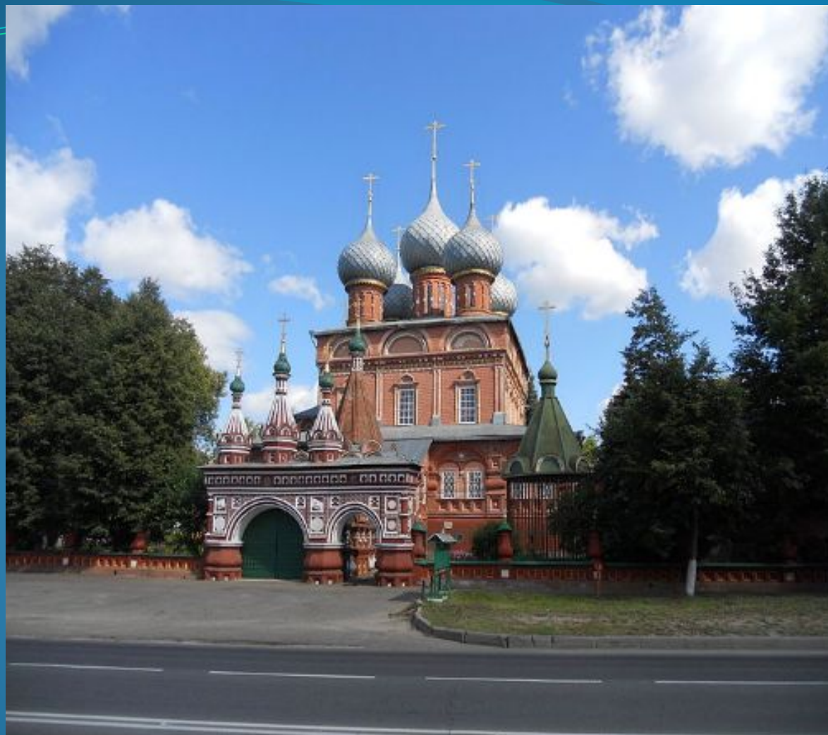
Церковь Воскресения Христова на Дебре