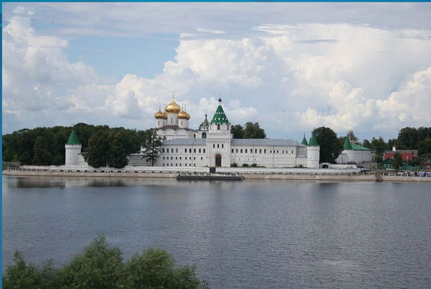
Свято-Троицкий Ипатьевский монастырь