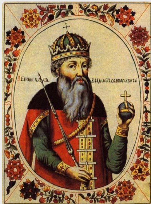
Владимир Красное Солнышко